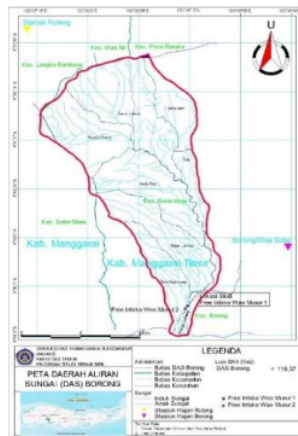
Gambar 2. Peta free intake Wae Musur 1 dan 2

16 Secara administrasi wilayah Daerah Aliran Sungai (DAS) Borong terletak di Kabupaten Manggarai Timur Provinsi Nusa Tenggara Timur. Kecamatan yang masuk DAS Borong yaitu Kecamatan Borong, Kecamatan Poco Ranaka, dan Kecamatan Rana Mese [6]. Untuk free intake Wae Musur 1 dan terletak di Kecamatan Borong. Berikut ini gambar 1 Peta free intake Wae Musur 1 dan 2