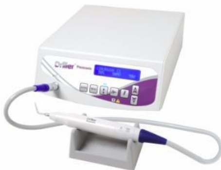
Figura 1 – Dispositivo piezoelétrico (Piezosonic – Driller).

painel, responsável por ajustar em qual frequência usar o dispositivo, bem como quantidade de irrigação (Alberto, et al., 2015). Sendo que, também é possível encontrar alças que podem irrigar, bomba peristáltica (atua na irrigação do líquido de resfriamento) (Carvalho-Reis, et al., 2017).