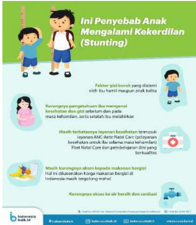
Gambar 3. Penyebab anak menjadi kerdil

Palolit alekot in amnekin anbi tabu ahunut, ma palolit mese es le mnahat manesa neu aof tauf ka natisi nani fa, talante li ana le nahonis fe kan tiafa funan napeni menas ma in mafenan anbi pinan. Lasi an nao natuin amnahat manesa ka natebon, ka ala anbi tabu nahonis li ana mes nako tabu anah anbi aput in nanan. Nane in amnekin es le anah taun tuk tuka :