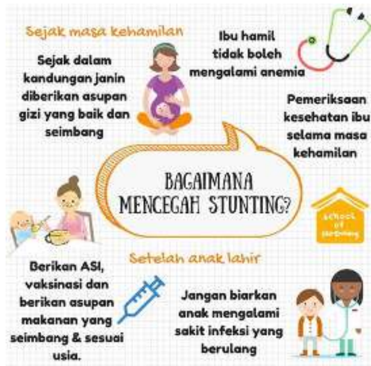
Gambar 5. Pencegahan stunting

Hit mes tahine natuin Pakas anfani lasi menas le in amnekin ka lekof ma li ana in aon ka natolo ma nanaefa nok leko talan te in na nae, him sa so mi hine ale lalan lalan le het eka tani menpakas. Mi hine ma ampanat nai ale sa le hi mes minaoba he nati am eka menpakas. Tanaoba ale lalan he nati ta'eka menpakas leko nesi ttanaoba tahunun nako fe ka aput ma leka apaut namsopu.