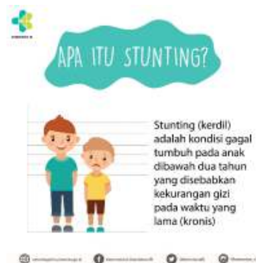
Gambar 1. Penjelasan Apa Itu Stunting

Atakaf nako tauf le anpakas (stunting) es le tabu li ana in am nanun an labu leka tanesa in nok anah bian le na honis sin tabu mese.