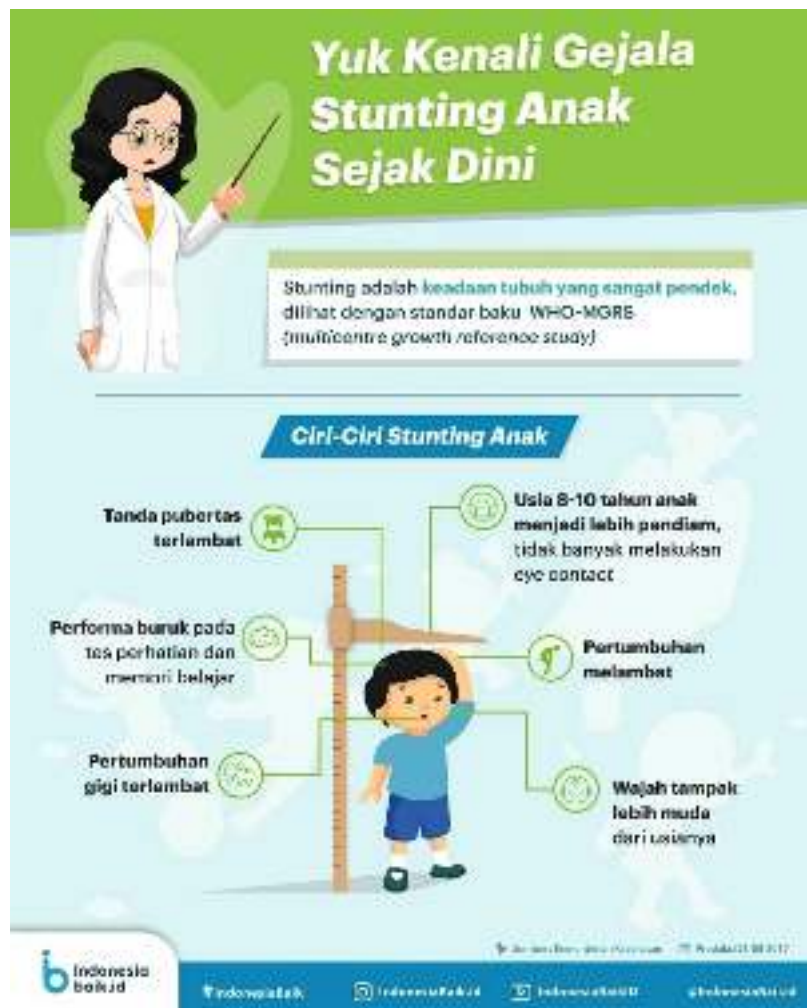
Gambar 4. Pengenalan gejala stunting pada anak

Anah mese in ma soit on le anpakas (stunting) ai in kanpakas nane tahine nako amnanun le ma leti. On nane hit ka taksel fa kalu anah nane ka ma leti.