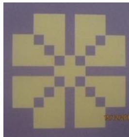
Gambar 6. Motif tampuk manggis tapak catur

Motif pucuk rebung memiliki makna nilai kesuburan, nilai kesuburan yang yang memiliki makna hidup yang seimbang dan makmur dalam kehidupan dengan menciptakan kehidupan yang aman dan damai. Nilai kesuburan yang terdapat pada corak tampuk manggis tentunya tidak lepas dari makna kejujuran. Hal ini karena kejujuran suatu hal yang penting bagi kehidupan (Mita Sapitri, 2022:158).