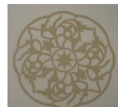
Gambar 10. Motif bulan mengambang