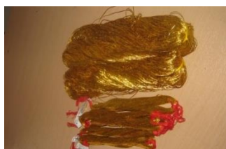
Gambar 2. Bahan benang emas untuk pembuatan Tenun tradisional