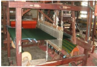
Gambar 3. Peralatan tenun tradisional

k. Tinjakan , yaitu tempat tumpukan kaki pada saat menenun