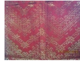
Gambar 8. Jenis motif siku kaluang beragi

Motif hewan diambil dari nama-nama hewan seperti semut, burung, ikan, ayam, lebah, itik, ulat, ular, belalang, Kalong ( keluang ) dan sebagainya. Unsur-unsur yang diambil dari bentuk hewan ini berupa unsur sebagian atau keseluruhan seperti kepala, badan, ekor, sayap maupun kaki hewan tersebut. Menurut Mita Safitri, bahwa motif dengan corak semut beriring memiliki makna identik dengan nilai kerukunan yang memiliki makna mencintai kedamaian dan gotong royong. Pada motif siku keluang memiliki nilai tanggungjawab (2022:158).