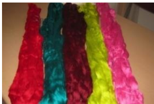
Gambar 1. Bahan benang katun untuk pembuatan Tenun tradisional

Bahan yang digunakan adalah bahan khusus dan umumnya menggunakan bahan kain diantaranya benang katun dan benang emas. Benang katun adalah bahan dasar dalam pembuatan tenun tradisional, sedangkan benang emas merupakan bahan dasar pembuatan motif pada tenunannya. Pada umumnya bahan benang baik katun maupun benang emas atau perak didatangkan dari India yang sudah dijualbelikan melalui distributor.