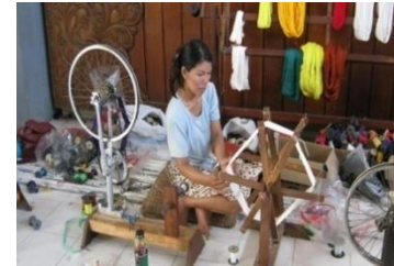
Gambar 4. Proses mengelos benang yang dilakukan oleh perajin