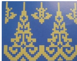
Gambar 7. Motif hias pucuk rebung Bertabur pada kain tenun

Motif hewan diambil dari nama-nama hewan seperti semut, burung, ikan, ayam, lebah, itik, ulat, ular, belalang, Kalong ( keluang ) dan sebagainya. Unsur-unsur yang diambil dari bentuk hewan ini berupa unsur sebagian atau keseluruhan seperti kepala, badan, ekor, sayap maupun kaki hewan tersebut. Menurut Mita Safitri, bahwa motif dengan corak semut beriring memiliki makna identik dengan nilai kerukunan yang memiliki makna mencintai kedamaian dan gotong royong. Pada motif siku keluang memiliki nilai tanggungjawab (2022:158).