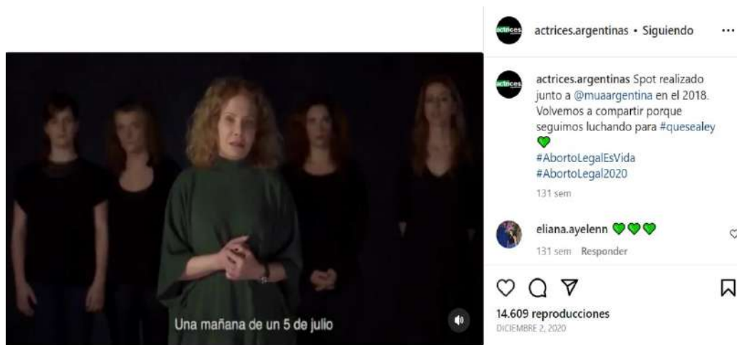
Imagen 1: “Campaña Relatos basados en testimonios reales”

Esta unidad, que no se menciona pero se expresa, se hace también hashtag: #unidad comienza a ser incorporado desde los inicios de la actividad del colectivo en la red social (Actrices Argentinas 2018b). Este acuerdo, sin embargo, no es solo entre las actrices argentinas. Al examinar el muro de lo publicado durante 2018 y 2020, se encuentra que, en su campaña por la legalización del aborto, @actrices.argentinas realizó distintas acciones con otras asociaciones, entre ellas Mujeres Audiovisuales -con quienes plasman spots y videos con producción-, Teatro por la Identidad y la asociación Madres de Plaza de Mayo. Asimismo, definen como “tejiendo redes” a las iniciativas de difusión que llevan a cabo con @emergentesmedio, @lasrevueltas, @larevueltacolectivafeminista.