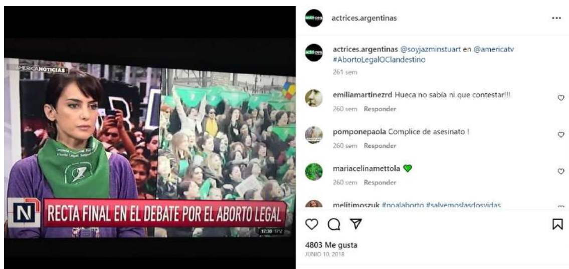
Imagen 3: Ejemplo de la presencia de @actrices.argentinas en medios de comunicación.

Este juego entre accionar digital de las actrices-medios de comunicación tradicionales (Imagen 3) se observa en varios de los posts del colectivo, con entrevistas a algunas de las participantes del colectivo que se dan en momentos claves de la campaña: antes de las votaciones y/o para convocar a marchas.