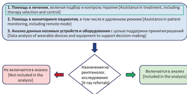
Рис. 1. Процесс отбора СППВР [Fig. 1. CDSS selection process]

согласно списку нормативных документов в области радиационно-гигиенического регулирования оказания медицинской помощи (представленному в приложении 1).