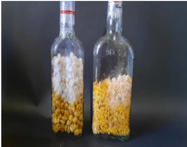
Gambar 5. Bibit F1

Media F2 ini kaya akan unsur selulosa seperti media baglog jamur. Bibit F1 diinokulasikan ke media bibit F2. Sebanyak empat puluh botol kaca dipersiapkan untuk media bibit produksi (F2). Hasil yang didapat, petani mitra telah berhasil membuat bibit produksi (F2) (Gambar 6) dan bibit F2 ini diuji coba ke dalam media baglog jamur tiram. Setelah uji coba ke media baglog, panen perdana jamur hasil bibit telah diperoleh (Gambar 7).