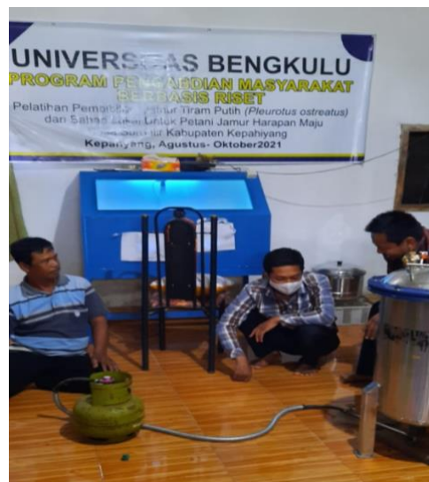
Gambar 1. Para peserta sedang mencoba peralatan pembibitan

Tahap awal dari kegiatan pelatihan pembuatan bibit jamur dimulai dengan persiapan bahan dan alat serta sterilisasi semua peralatan yang digunakan antara lain kamar laminar, cawan petri, botol untuk bibit, dan semua peralatan yang dibutuhkan. Kegiatan pembibitan harus dilakukan dalam keadaan aseptik. Kamar laminar dibersihkan dan didesinfektan. Semua peralatan pembibitan seperti cawan petri, botol bibit, pisau, sudip dan ose semua disterilkan dengan pemanasan dalam autoklaf pada suhu 121°C selama 15 menit. Kegiatan ini dapat dilihat di Gambar 1.