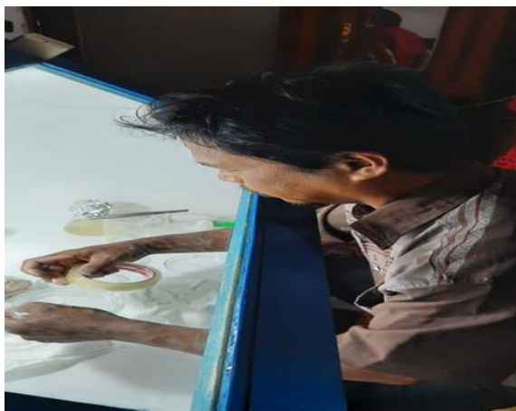
Gambar 3. Peserta praktik menginokulasi bibit jamur di media PDA

Petani mitra dilatih untuk terampil membuat media PDA lokal dan menginokulasi bibit jamur (eksplan) ke dalam cawan petri. Percobaan ini telah dilakukan sebanyak tiga kali. Hal ini karena terjadi kontaminasi sehingga harus diulangi kembali. Kegagalan ini memberi pelajaran ke petani mitra bahwa proses pembuatan bibit harus dilakukan dalam keadaan aseptik(steril). Respon petani sangat baik dan tetap bersemangat untuk terus mencoba. Pada percobaan yang keempat petani berhasil mendapat bibit F0 tidak terjadi kontaminasi.