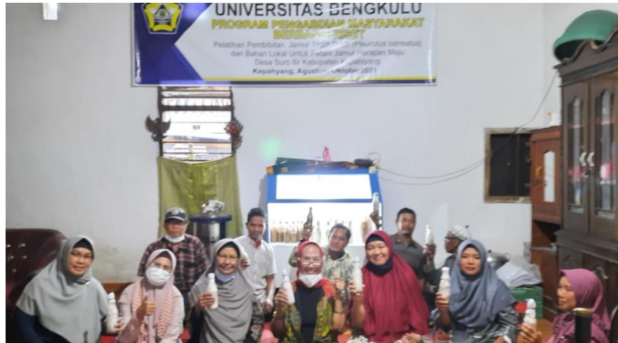
Gambar 8. Kegiatan Monitoring Oleh Tim LPPM Univ. Bengkulu

dapat terus berlanjut dengan terus membina komunikasi setelah kegiatan pengabdian dan kegiatan lain berupa pengolahan aneka produk dari jamur tiram dan pengolahan limbah baglog jamur tiram yang masih dibuang/dibakar begitu saja. Kadarsah dkk. (2022) melaporkan bahwa limbah baglog jamur tiram dapat dikelola menjadi pupuk dan media tanam sayur. Dengan demikian pada program pengabdian berikutnya kegiatan pemanfaatan limbah baglog dapat diterapkan.