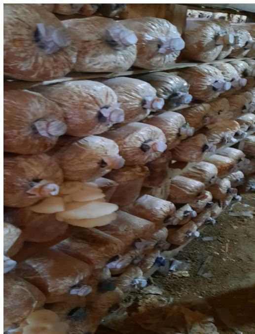
Gambar 7. Uji coba bibit jamur ke media baglog