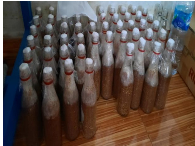
Gambar 6. Bibit F2