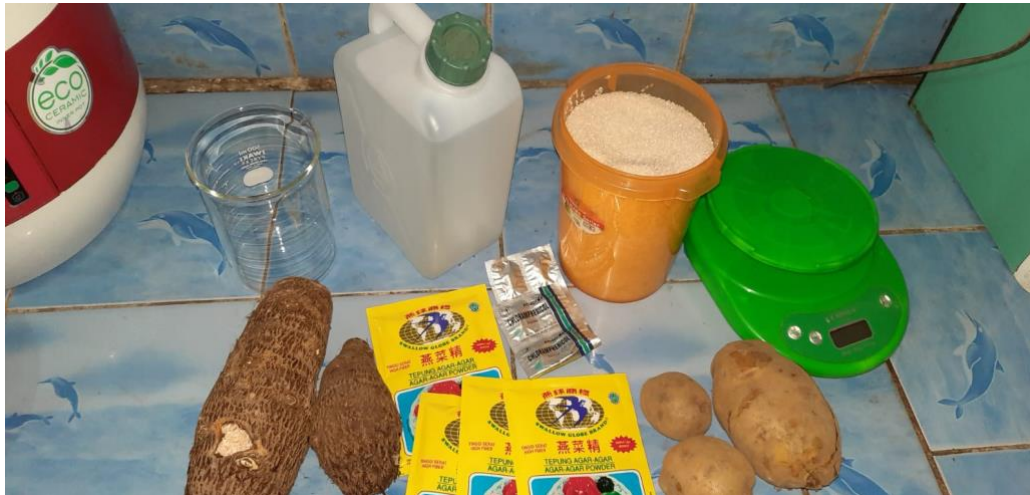
Gambar 2. Bahan-bahan untuk membuat media bibit F0

Petani mitra dilatih untuk terampil membuat media PDA lokal dan menginokulasi bibit jamur (eksplan) ke dalam cawan petri. Percobaan ini telah dilakukan sebanyak tiga kali. Hal ini karena terjadi kontaminasi sehingga harus diulangi kembali. Kegagalan ini memberi pelajaran ke petani mitra bahwa proses pembuatan bibit harus dilakukan dalam keadaan aseptik(steril). Respon petani sangat baik dan tetap bersemangat untuk terus mencoba. Pada percobaan yang keempat petani berhasil mendapat bibit F0 tidak terjadi kontaminasi.