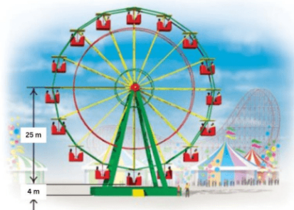
Gambar 1. Masalah Trigonometri

Lia akan menaiki wahana bianglala. Jarak kursi bianglala dengan pusat roda adalah 25 meter. Saat Lia menaiki bianglala, Lia berada 4 meter di atas tanah. Setelah berputar 585^\circ bianglala berhenti. Berapa jarak posisi Lia sekarang dengan tanah?