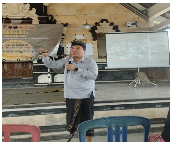
Gambar 3. Tim PKM Melaksanakan Sosialisasi dan Edukasi

Kegiatan edukasi dan sosialisasi yang dilakukan terdiri dari presentasi dan diskusi (Gambar 3). Tim PKM menyampaikan ide-ide tentang masalah lingkungan dan peluang pemanfaatan lubang resapan biopori kepada masyarakat (Gambar 4). Materi yang dibahas termasuk: manfaat lubang resapan biopori; metode pembuatan; dan lokasi yang tepat untuk lubang resapan biopori. Alat dan peralatan yang diperlukan untuk membuat lubang biopori, jenis sampah rumah tangga yang dapat dimasukkan ke dalam lubang biopori, metode memanen kompos yang dihasilkan dari lubang biopori, dan cara merawat lubang biopori.