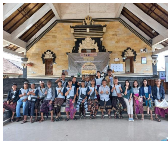
Gambar 4. Tim PKM Melaksanakan Kegiatan Pengabdian Kepada Masyarakat

Tujuan sesi diskusi adalah untuk mendapatkan lebih banyak informasi dan meningkatkan pemahaman masyarakat tentang cara biopori dikelola dengan baik. Masyarakat Desa Manikliyu sangat antusias untuk berpartisipasi dalam kegiatan ini, seperti yang ditunjukkan oleh respons yang positif dan jumlah peserta yang aktif yang bertanya tentang lubang resapan biopori. Saat diskusi berlangsung, banyak pertanyaan yang diajukan oleh peserta mengenai lubang resapan biopori. Peserta bertanya tentang pembuatan lubang resapan biopori dan bagaimana memasang pipa paralon untuk mencegah longsor di dalam lubang tersebut. Mereka juga bertanya tentang manfaat lubang resapan biopori, yang selain dapat digunakan untuk mencegah banjir juga dapat digunakan untuk menghasilkan pupuk kompos. Untuk membuat kompos, sampah organik seperti rumput kering, daun-daun, dan sampah dapur dimasukkan ke lubang biopori. Setelah beberapa minggu, kompos dapat diambil dari lubang biopori untuk memupuk tanaman.