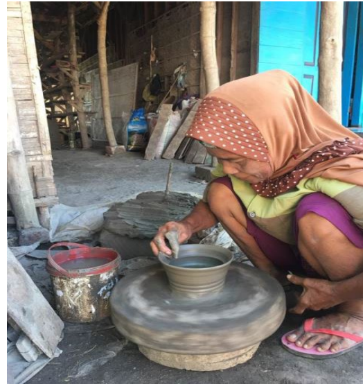
Gambar. 1 Proses produksi

Hasil kuesioner yang diperoleh peneliti terhadap pelaksanaan analisis peningkatan perekonomian melalui pemberdayaan perempuan dan UMKM kerajinan tanah liat di desa Laren Lamongan terhadap responden yang berusia 35 sampai 58 tahun. ada 50 responden yang mengisi lembar kuesioner sesuai dengan teknis yang telah peneliti siapkan. Hasil kuesioner terhadap warga difokuskan pada seputar pengertian peningkatan perekonomian, pemberdayaan perempuan, proses produksi periuk dan juga proses pemasarannya yaitu : 1) pemberdayaan perempuan desa. 2) perkembangan kerajinan tanah liat. 3) proses pemasarannya. 4) proses produksi. 5) bentuk partisipasi masyarakat dan pemerintah daerah mengenai peningkatan perekonomian. 6) kenaikan pendapatan dan perkembangan perekonomian desa laren Lamongan. 7) Pendampingan dan evaluasi untuk melakukan perbaikan secara terus menerus (KAIZEN).