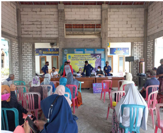
Gambar. 3 Workshop pendampingan UMKM dan pencairan dana bantuan pemerintah

pengrajin UMKM tanah liat Laren Lamongan dengan menggerakkan para generasi muda dan perangkat desa untuk lebih memperhatikan perkembangan UMKM tanah liat desa Laren sehingga diharapkan mampu meningkatkan pendapatan pengrajin UMKM tanah liat Laren serta perekonomian masyarakat desa Laren Lamongan pada umumnya.