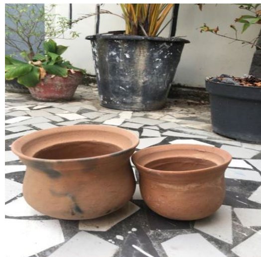
Gambar. 2 Produksi periuk UMKM Laren

Proses produksi yang masih tradisional cenderung membuat produksi sulit berkembang dan membuat produksi membutuhkan waktu yang lama.peningkatan produksi melalui (ciri khas,kreativitas dan inovasi produk).kendala yang muncul adalah kurang adanya kreativitas yang mengikuti trend zaman dan inovasi produk terutama pada jenis varian produk.