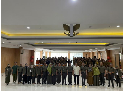
Gambar 2. Pelaksanaan PkM