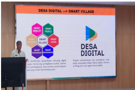
Gambar 3. Pemberian Materi

Melalui berbagai bentuk atau metode yang diberikan dalam kegiatan PPM dengan judul “Pelatihan Tata Kelola Pemerintahan Desa Melalui Konsep Smart Village Government di Kabupaten Bandung”, hasilnya dapat membantu peningkatan kualitas sumber daya manusia dan perangkat pengelolaan desa para kepala desa. Kabupaten Bandung sebagai modal unggulan pengelolaan organisasi pemerintahan, termasuk organisasi pengelolaan desa, untuk melaksanakan proses pengelolaan desa di masa digitalisasi dan globalisasi. Penggunaan teknologi informasi dalam organisasi pemerintahan saat ini sudah menjadi kebutuhan akan keahlian teknologi. Sumber daya peralatan tersebut harus