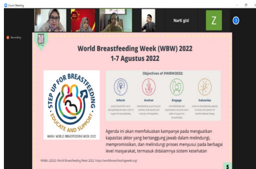
Gambar 1. Proses Pemaparan Materi