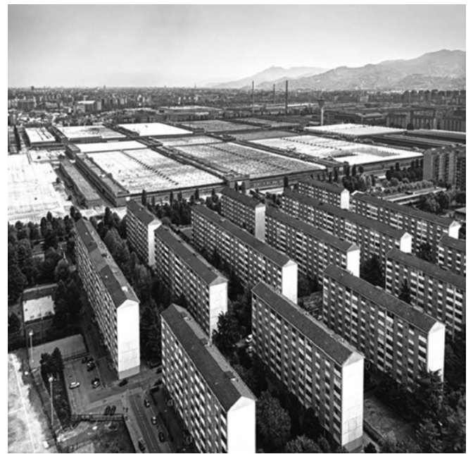
Figura 4. Edilizia residenziale a Mirafiori, 1960.

L'ideologia della produzione che innerva le culture tecniche e progettuali della città, è capace di autorappresentazioni emblematiche, come il Palazzo del Lavoro o il Palazzo a Vela