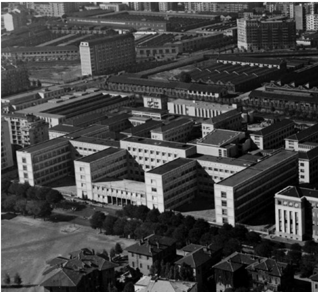
Figura 1. Politecnico di Torino, 1958.