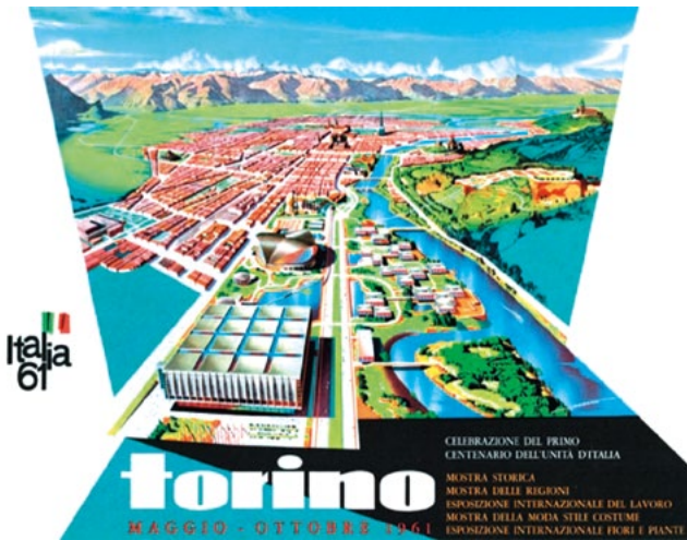
Figura 5. Manifesto promozionale dell'Esposizione Internazionale del lavoro Italia 61, 1961.

realizzati per le celebrazioni di Italia '61: simboli della nuova città opulenta promossa dal boom economico (Fig. 5). Ovviamente il processo di proiezione collettiva su nuovi artefatti non è univoco. Alla retorica della affluent society prodotta dalla fabbrica, si oppone un progetto altrettanto ideologico di riequilibrio sociale. Le "giunte rosse", che a metà degli anni Settanta amministrano il territorio, introducono ad esempio nell'organizzazione dei trasporti pubblici il passaggio da un sistema di distribuzione radiale (e quindi socialmente gerarchico) a uno a griglia ortogonale (isotropo) e tentano con una proposta di PRG (poi abortita) di riorientare la crescita secondo vettori di espansione che massimizzino il valore delle aree non in funzione del suo centro simbolico, ma della sua distribuzione abitativa (e quindi produttiva).