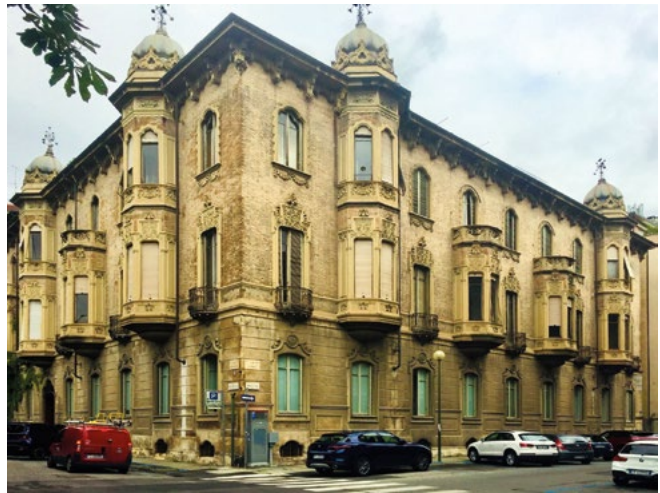
Figura 6. Edificio di corso Montevecchio 38, Torino, sede di Scienza Nuova.

Definito questo quadro, necessariamente schematico, in cui la figura dell'ingegnere politecnico era saldamente ancorata a una prospettiva d'azione definita a scala territoriale,