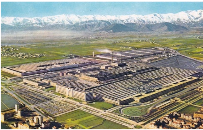
Figura 2. Stabilimenti Mirafiori.