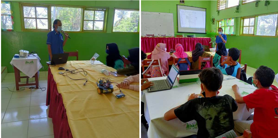
Gambar 2. Pelaksanaan Pelatihan Robotika Dasar

Sebagai bahan evaluasi untuk mengetahui ketercapaian pelaksanaan pengabdian kepada masyarakat ini, tim pelaksana memberikan kuesioner kepada guru dan siswa dalam bentuk google form. Pertanyaan yang diberikan kepada siswa terkait dengan pemahaman guru dan siswa sebelum dan sesudah pelatihan, yaitu : Pemahaman terhadap materi pengenalan robotika (P1), Pemahaman tentang komponen pendukung pembuatan robot sederhana (P2), Pemahaman tentang aplikasi pembuatan program robot sederhana (P3), Tingkat kesukaan siswa terhadap materi robotika (P4)