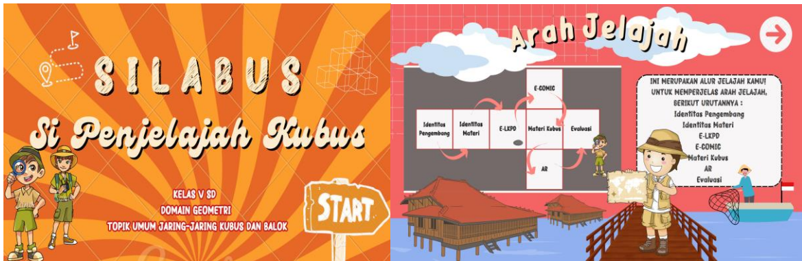
Gambar 3. Tampilan Awal Video Silabus (Si Penjelajah Kubus)

Pada tahap pengembangan, dilakukan strukturisasi flowchart yang telah dibuat dalam bentuk produk berupa alur konten video. Hasil dari pengembangan produk tersebut selanjutnya divalidasi oleh validator ahli kemudian direvisi kembali sesuai dengan saran yang diberikan. Pengembangan produk dibuat dengan mengolaborasi antara materi ajar dengan nilai-nilai lokal yang dipadukan berdasarkan sintaks pembelajaran saintifik. Flowchart menggambarkan alur pengembangan produk dan penerapan desain video berdasarkan seluruh analisis kebutuhan. Langkah pertama yang dilakukan adalah membuat bagian interface sebagaimana tema pendekatan pembelajaran etnopedagogik berbasis saintifik untuk anak Sekolah Dasar (Gambar 3).