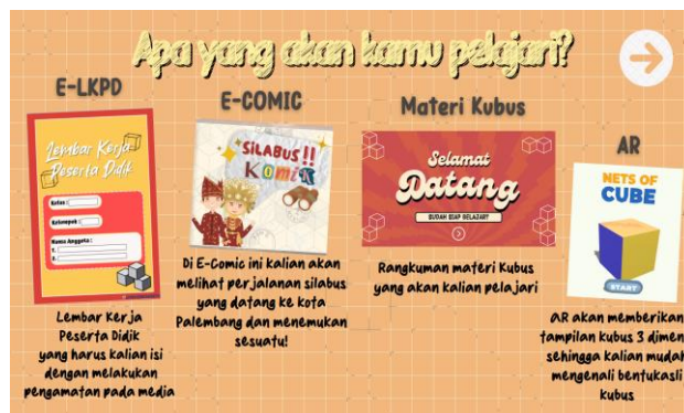
Gambar 4. Penjelasan Menu dalam Video Interaktif

Gambar di atas menunjukkan tampilan awal video dan petunjuk penggunaan video yang ditampilkan dalam menu Arah Jelajah. Menu ini memberikan informasi urutan menu dalam video yang harus dipelajari siswa agar mendapatkan informasi yang lengkap tentang materi ini. Dalam video ini terdapat menu berupa identitas pengembang, identitas materi, e-LKPD, e-comic, Augmented Reality dan evaluasi (Gambar 4).