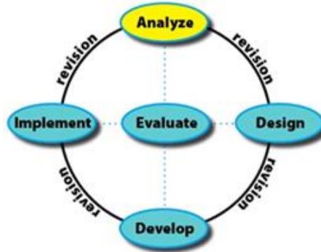
Gambar 1. Elemen Dasar Model ADDIE

Uji kelayakan dilakukan melalui uji validitas. Sebelum melakukan uji validitas, video interaktif dikembangkan melalui analisis kebutuhan yang dilanjutkan dengan tahapan desain dengan membuat flowchart serta storyboard video. Untuk pengumpulan data uji validitas dilakukan melakukan validasi pada ahli desain media. Tujuannya validasi yang dilakukan adalah untuk menganalisis kevalidan dari produk yang telah dikembangkan. Gambar 1 berikut ini merupakan alur penelitian dan penjelasan untuk setiap tahapan pengembangan secara lebih lengkap.