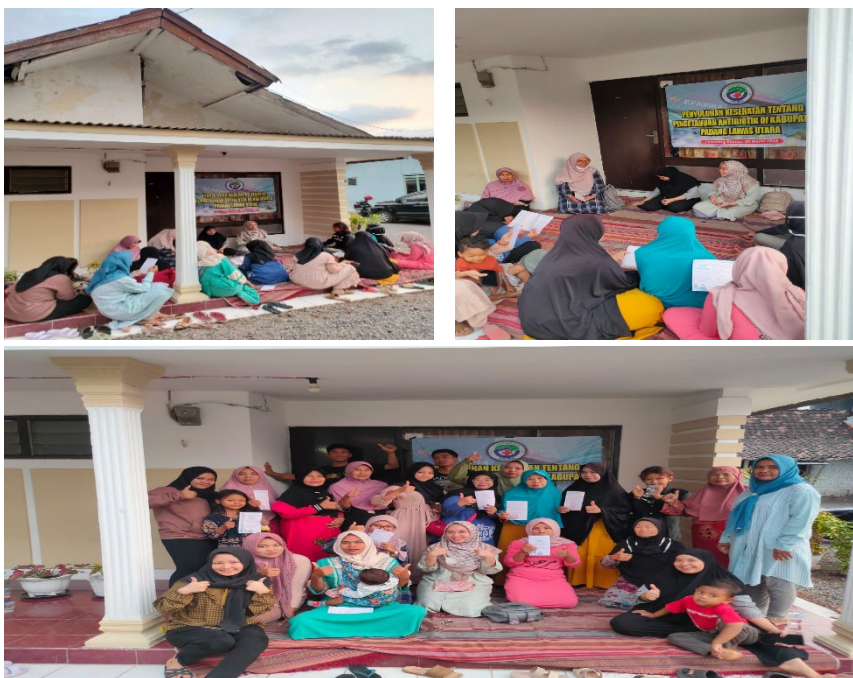
Gambar 2. Penyuluhan Kesehatan Tentang Pengetahuan Antibiotik

Upaya sosialisasi ini diyakini akan meningkatkan kesadaran masyarakat. Salah satu jenis pengabdian masyarakat ini dapat mempengaruhi pengetahuan dan sikap masyarakat mengenai kesadaran penggunaan antibiotik. Responden akan memperoleh pengetahuan dan informasi melalui kegiatan edukasi berupa penyuluhan, sehingga berujung pada perubahan perilaku dan tindakan yang akan dilakukan. Strategi pengendalian primer menyarankan untuk mempromosikan penggunaan antibiotik yang tepat sambil memberikan edukasi kepada masyarakat umum (Andre, 2010).