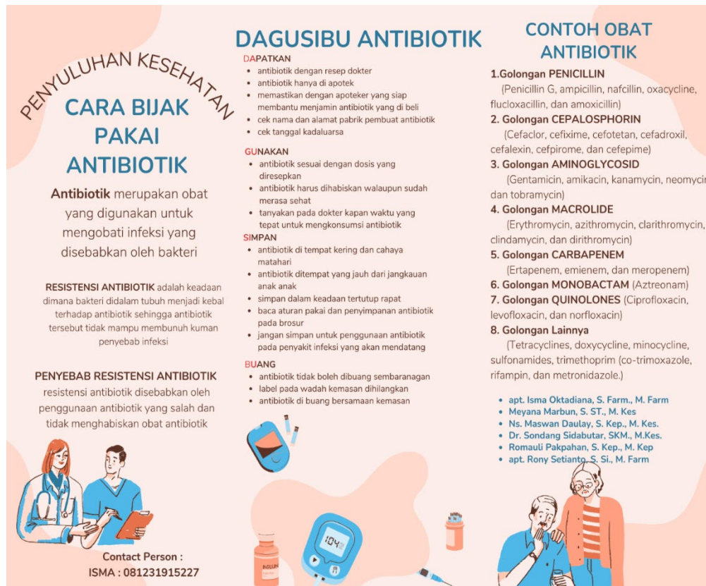
Gambar 1. Brosur Kegiatan