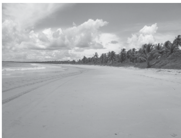
FOTO 6. Urbanização baixa na praia do Encanto, na Ilha de Tinharé.