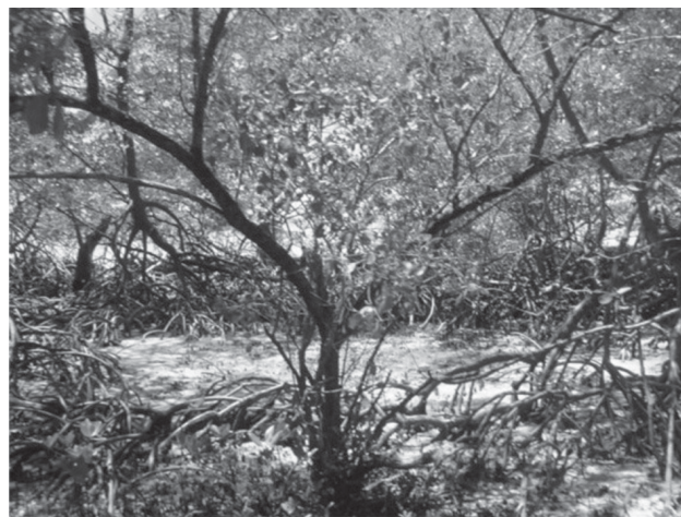
FOTO 2. Manguezais ao norte da praia de Guarapuá, Ilha de Tinharé.