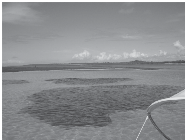
FOTO 3. Piscinas naturais formadas por recifes de corais na praia de Moreré, Ilha de Boipeba.

Outra unidade geoambiental de importante ocorrência nesta região é composta pelos recifes de corais (Figura 1) (Foto 3). Constituem um dos principais ecossistemas costeiros, com grande importância biológica e ecológica, além de servirem como atrativo para o turismo e, normalmente, protegerem a costa da ação das ondas. Os recifes de corais são também responsáveis pela produção de matéria orgânica e reciclagem de nutrientes, beneficiando inúmeras espécies de peixes, crustáceos, moluscos e ouriços. Nas Ilhas de Tinharé e Boipeba predominam os recifes em franja e, em alguns casos, como na Ponta dos Castelhanos, na Ilha de Boipeba, eles são utilizados como substrato para manguezais (Freitas, 2002).