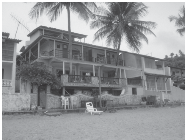
FOTO 4. Construções à beira mar em Morro de São Paulo.

Fundamentalmente, a erosão costeira está relacionada à existência de um déficit no balanço de sedimentos litorâneos. Alguns locais são favorecidos por importantes contribuições fluviais ou através da deriva