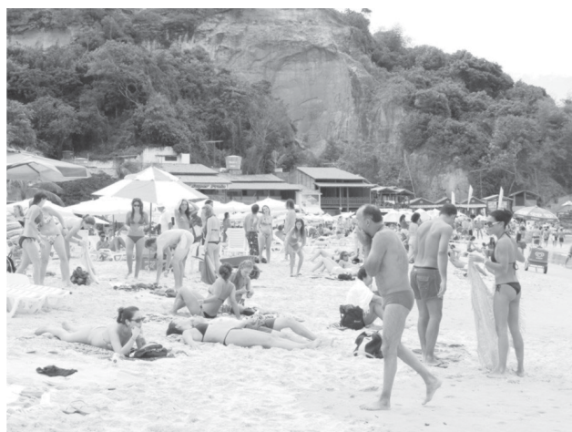
FOTO 1. Falésias expostas na Segunda Praia, em Morro de São Paulo, Ilha de Tinharé.