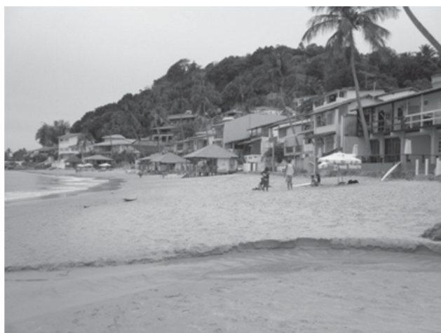
FOTO 8. Urbanização alta na Primeira Praia, na Ilha de Tinharé.

litorânea, enquanto que, em outros trechos da costa, ocorre perda de sedimentos litorâneos para construir campos de dunas, captura de sedimentos em pontais arenosos, decréscimo no suprimento de sedimento pelo represamento de rios, perda de sedimentos em zonas de divergência da deriva ou falta de importantes fontes de suprimento de sedimentos. O balanço de sedimentos pode ser alterado também através de obras de engenharia costeira, como a construção de portos, molhes, quebra-mares, etc. Estas construções geralmente bloqueiam a deriva litorânea, causando erosão a barlamar da área.