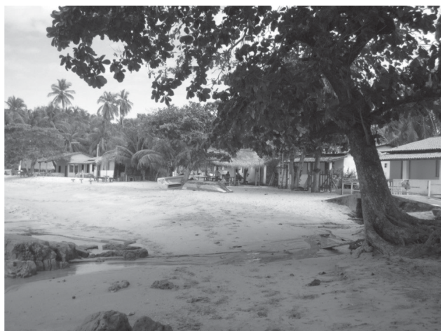
FOTO 7. Urbanização média na praia de Moreré, na Ilha de Boipeba.