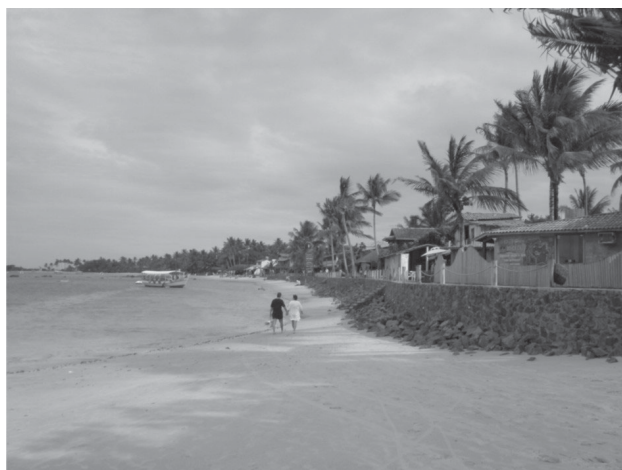
FOTO 5. Obra de contenção à erosão em Morro de São Paulo.