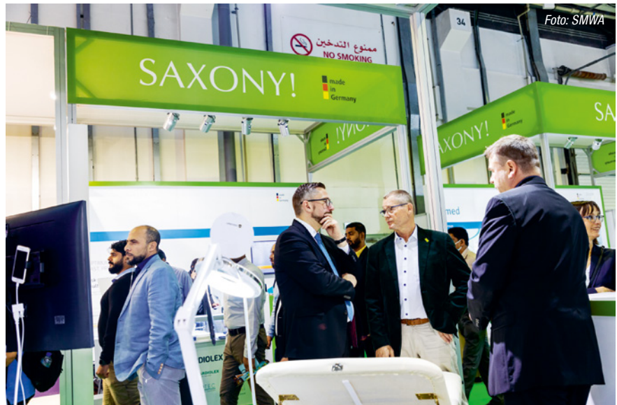
Wirtschaftsminister Dulig besucht den sächsischen Gemeinschaftsstand auf der Arab Health 2023

„Internationale Messen in Deutschland und im Ausland sind und bleiben im Vertriebs- und Marketing-Mix der Unternehmen ein wichtiges Instrument, um überregionale und internationale Kunden- und Zulieferbeziehungen aufzubauen sowie neue Märkte zu erschließen. Dabei lassen sich im direkten und persönlichen Kontakt am besten neue Partner finden, die Kundenbindung nach-