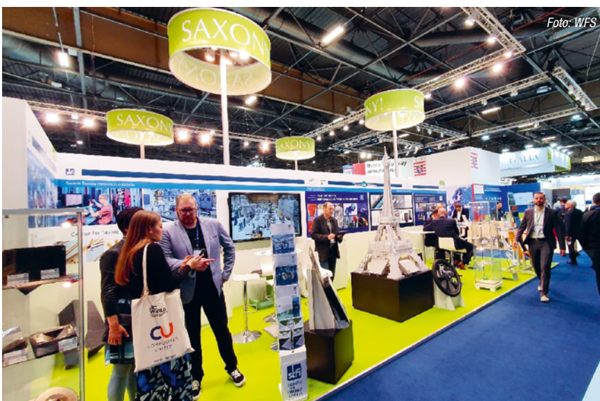
Sächsischer Gemeinschaftsstand auf der JEC 2023

(22. bis 26. April 2024) Weltleitmesse der Industrie