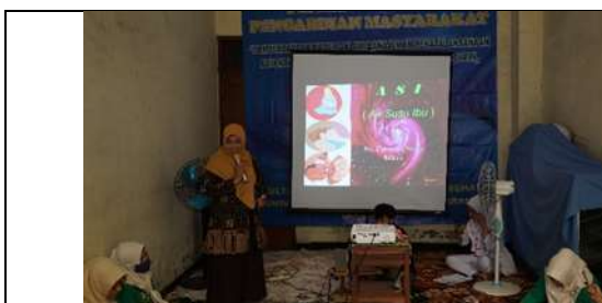
Gambar 2 Penjelasan materi tentang ASI