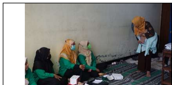
Gambar 6. Cara penanganan Masalah Menyusui