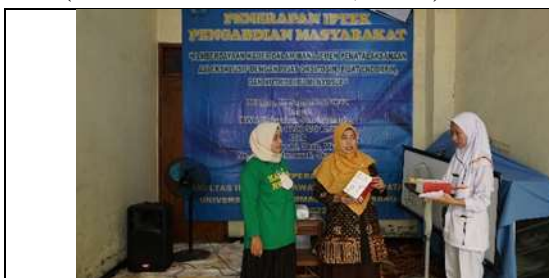
Gambar 1 Penyerahan Bantuan brast Pamp dan Tensimeter

Pada pengmbas ini tersusun SOP serta kartu manajemen untuk memonitor pelaksanaan pemberian ASI eksklusif. SOP atau kartu manajemen sangat dibutuhkan supaya kader mudah dalam memonitor pelaksanaan pemberian ASI eksklusif, serta pemangku kebijakan dapat mengevaluasi terlaksananya pemberian ASI eksklusif. Hal tersebut sejalan dengan penelitian anggraini (2020) bahwa dibutuhkan SOP dalam pemberian ASI eksklusif (ANGGRAINI & Idris, 2020).