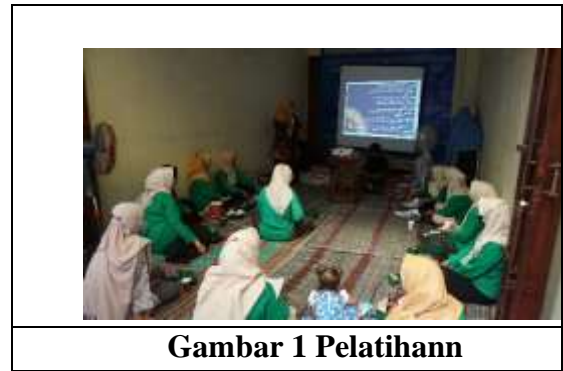
Gambar 1 Pelatihann

Kegiatan pengabdian masyarakat berupa Pendidikan Kesehatan, pelatihan dan pendampingan seperti terlihat pada gambar 1. Responden pengabdian masyarakat ini adalah anggota Kader Posyandu dan BKB Balita Sehat Desa Dadapan RW 2 Sendangmulyo sejumlah 25 responden. Rata-rata pendidikan responden Sekolah menengah Atas (SMA) (60%), responden berpendidikan sarjana 3 (12%). Rata-rata menjadi kader 4 tahun. Rata-rata pengetahuan kader tentang asi eksklusif, pijat oksitosin, pinat endhorphin dan nutrisi ibu menyusui sebelum pelatihan 2,2 (+1,242) kategori cukup, Rata-rata pengetahuan kader tentang Asi eksklusif, pijat oksitosin, pinat endhorphin dan nutrisi ibu menyusui setelah pelatihan 3,43 (+1,006) kategori baik.