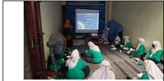
Gambar 3 Penjelasan materi tentang Gizi ibu Menyusui