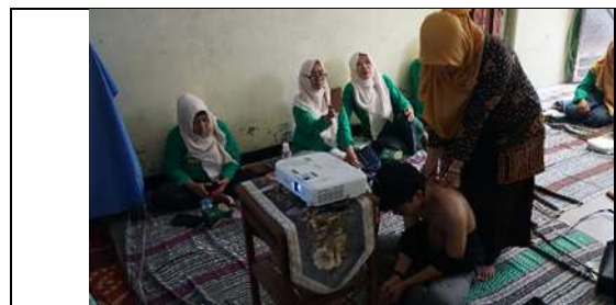
Gambar 5. Praktek Pijat Oksitosin