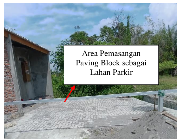
Gambar 8. Hasil Pemasangan Paving Block sebagai Area Parkir dan Jalan