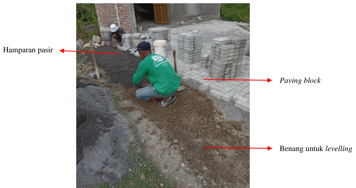
Gambar 5. Levelling pada Pemasangan Paving Block

dilakukan secara sederhana menggunakan bantuan pasak dan benang yang ketinggian dan panjangnya telah ditentukan sebelumnya sesuai dengan desain rencana.