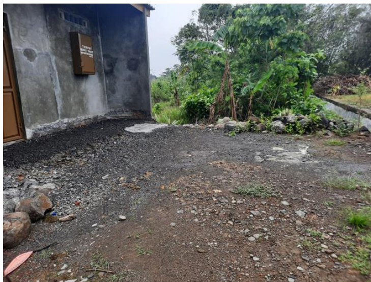
Gambar 2. Kondisi Lahan dan Tanah pada Lokasi Rencana Pembangunan

Berdasarkan identifikasi secara visual, tanah di area pemakaman Al-Hanafi Tlogosari Wetan merupakan tanah lempung dengan pasir dan kerikil di permukaan tanah. Selain itu, terdapat rumput dan batuan besar dengan kemiringan tanah yang bervariasi sehingga menyebabkan permukaan tanah tidak rata, sebagaimana dapat dilihat pada Gambar 2.