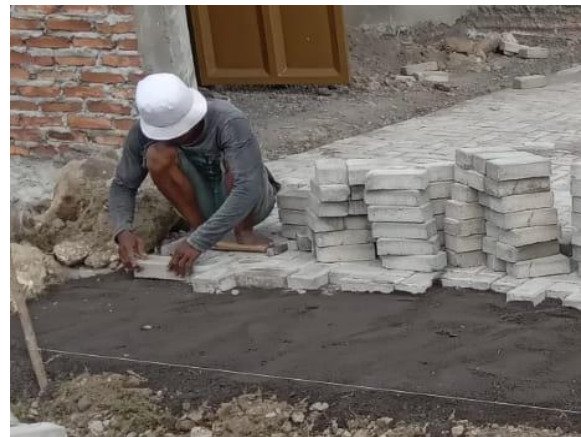
Gambar 7. Pemasangan Paving Block dengan Pola Herringbone 90 0

Selanjutnya dilakukan pengisian celah naat paving block menggunakan pasir/ abu batu. Kegiatan ini dilakukan dengan dengan melakukan sapuan ke celah-celah (rongga) naat antar susunan paving . Pengisian celah ini bertujuan agar paving block yang terpasang tidak goyang dan terkunci. Hasil akhir pekerjaan Pengabdian kepada Masyarakat, berupa pendampingan teknis pekerjaan pembuatan material pelapis tanah sebagai area parkir di Kompleks Pemakaman Al-Hanafi Pedurungan Semarang dapat dilihat pada Gambar 8. Terlihat bahwa area di depan Gudang pemakaman telah terpasang paving block sepenuhnya sehingga dapat membantu masyarakat untuk melaksanakan aktivitasnya. Area yang telah di pasang pelapis jalan berupa paving block ini merupakan produk/ hasil dari pengabdian masyarakat Departemen Teknik Sipil Universitas Diponegoro dengan Pengurus Area Pemakaman Al-Hanafi yang dibuat secara gotong royong dengan warga sekitar.