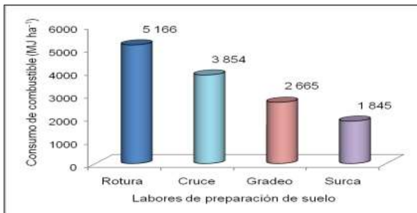
Figura 1. Energía asociada al consumo del combustible.

Es evidente que en la preparación de suelo es donde se tiene el mayor consumo de energía, en el caso que se analiza, el consumo de combustible marca una diferencia en el consumo energético en toda las labores, en particular en la labor de rotura, la cual reporta el mayor consumo de 5 166,00 MJ ha -1 , seguido en orden por cada una de las demás labores (Figura 1), de igual forma la energía humana consumida pero con valores de consumo discretos. Los valores de consumo de uso directo obtenidos en las cuatros labores están por debajo de los valores de energía obtenidos por Bailey et al. (2003) y Paneque y Soto (2007), haciendo uso de los arados de vertederas y de discos respectivamente.