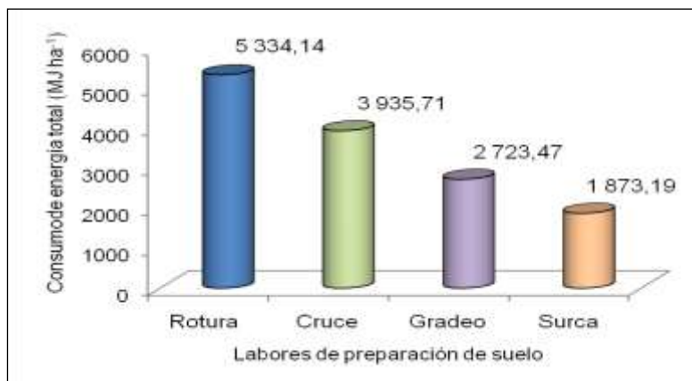
Figura 3. Consumo de energía total.

La energía total del proceso producto de la suma de la energía de uso directo e indirecto se caracteriza por la energía de entrada ( Input ), tal y como se muestra en la Figura 3, que la labor de rotura es quien presenta el mayor consumo energético 5 334,14 MJ ha -1 , superando en un 26 % al consumo de energía reportado en la labor de cruce. Estos valores superan a los obtenidos por Hetz y Barrios (1997), con un arado de vertedera y (Bailey et al. , 2003), y Paneque y Soto (2007), quienes utilizaron el arado y grada de discos, los primeros, y multiarado, los segundos.