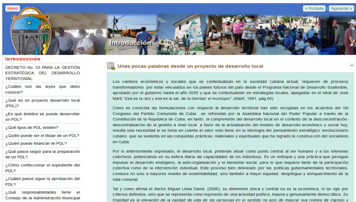
Figura 2. Menú de la multimedia

En la multimedia se puede encontrar un cuestionario interactivo de autoevaluación donde el promovente puede responder preguntas y en dependencia de su respuesta puede conocer si está apto para iniciar su PDL. Este cuestionario es utilizado en la Fase 1ra de la metodología facilitando el diagnóstico al tocar elementos como impacto social del trabajo a realizar, beneficios económicos personales y públicos que podría reportar, así como temas económicos como el financiamiento, el capital inicial y los posibles socios a tener en cuenta (Figura 2).