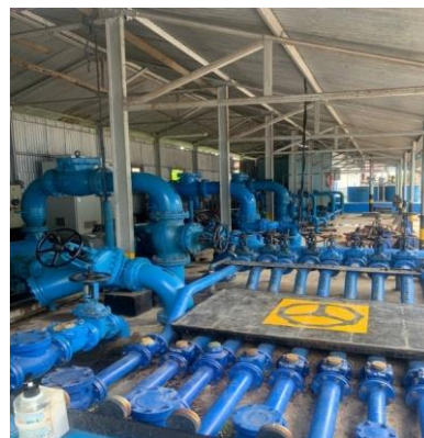
Gambar 3. Instalasi Pipa 6" dan Pipa 4"

Pada pompa feed sentrifugal terdapat Instalasi Pipa 6" dan Pipa 4" yang berfungsi untuk mengalirkan fluida ketempat yang dikehendaki dengan menggunakan pipa sesuai dengan spesifikasi Instalasi Pipa 6" dan Pipa 4"dapat dilihat pada Gambar 3