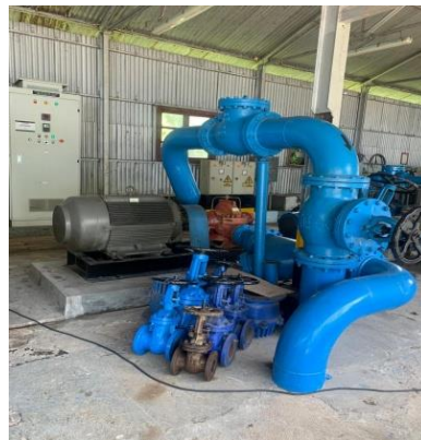
Gambar 2. Pompa Feed Sentrifugal P.100/4

Pompa Feed sentrifugal P.100/4 adalah salah satu jenis pompa yang digunakan di Kilang PPSDM Migas Cepu. Pompa ini berfungsi mengalirkan crude oil dari T.101 atau T.102 menuju Heat Exchanger untuk pemanasan awal. Pompa feed sentrifugal P.100/4 dapat dilihat pada Gambar 2