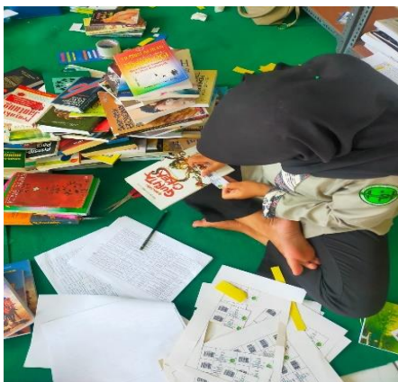
Gambar 4 Pemasangan Barcode

Pemberian label pada punggung buku / koleksi, labelling merupakan kegiatan pengolahan koleksi buku dengan menempelkan kode tertentu yang telah dibuat sebelumnya kegiatan labelling atau yang sering dikenal dengan penempelan kode buku berupa klasifikasi maupun nomor kode buku atau yang sering dikenal dengan nomor buku. Kegunaan dari kode barcode ini juga memudahkan pustakawan untuk temu kembali bahan pustaka apa bila ada pemustaka yang mencari bahan pustaka dengan menulis kode barcode yang sudah ada pada buku atau dengan cara scan barcode.