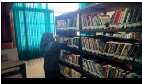
Gambar 6. Shelving bahan koleksi

penomoran yang telah dilakukan sebelumnya, yaitu nomor klasifikasi dengan demikian, pemustaka akan tahu harus mencari buku ke rak mana ketika mereka telah mendapatkan nomor panggil buku tersebut yang diperoleh dari katalog. Dan apa bila pemustaka mencari koleksi umum yang berada di UPT Perpustakaan UMMAT ini berada di lantai II, yaitu ruangan sirkulasi. dan apabila pemustaka mencari koleksi yang tdk bisa di pinjam atau skripsi yaitu berada di Lantai III atau Ruang Referensi.