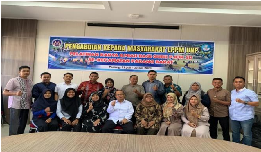
Gambar 1. Dokumentasi Kegiatan Pengabdian Pada Masyarakat Universitas Negeri Padang Di SD Se Kecamatan Padang Barat Kota Padang

Hasil kegiatan pengabdian ini terjadi peningkatan pengetahuan, keterampilan dan sikap peserta pelatihan. Hal ini sesuai dengan penelitian Made Agus Dharmadi, I Gusti Lanang Agung Parwata, Ni Putu Dwi Sucita Dartini (2021) menyatakan bahwa secara umum guru PJOK merasakan peningkatan pengetahuan dan pemahaman setelah diberikan pelatihan berupa penulisan artikel ilmiah dan publikasi ilmiah, sebanyak 100%. Bahwa dalam pelatihan penulisan artikel ilmiah, seluruh peserta telah menguasai dan paham atas konsep dasar penulisan artikel, sebanyak 100%. Di dalam pelatihan publikasi ilmiah, sebagian besar guru PJOK memahami terkait publikasi ilmiah sebanyak 70,9%. Kepada guru PJOK disarankan untuk terus meningkatkan pengetahuan dan keterampilannya di bidang IPTEKS, sehingga dapat menjalankan tugas-tugasnya secara profesional.