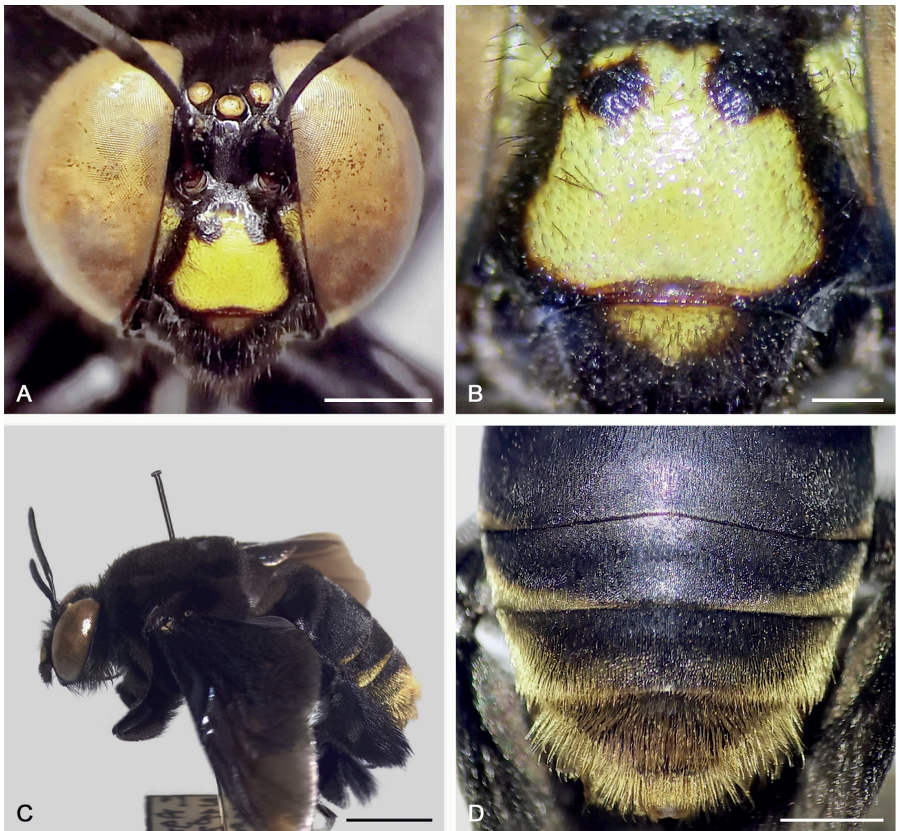
Figura 2. Macho de Centris melanochlaena Smith, 1874. a) Cabeza vista frontal (barra de escala 2 mm). b) Clípeo vista frontal (barra de escala 0.5 mm). c) Habitus vista lateral (barra de escala 4 mm). d) Metasoma vista dorsal (barra de escala 2 mm).

con márgenes laterales negros; mitad superior con dos manchas marrones oscuras, circulares (o relativamente elípticas) e irregulares, fusionadas con el margen superior (Figs. 2a, b). Pubescencia marrón, más clara en el área occipital. Mitad anterior del metasoma mayoritariamente con pubescencia negruzca, con la mitad posterior con pelos amarillentos (Figs. 2c, d). Margen inferior del clípeo cóncavo, más arqueado que el área central de la sutura epistomal. Margen lateral del clípeo casi llegando al ojo compuesto. Distancia más corta entre el ojo compuesto y el ocelo lateral aproximadamente la mitad del diámetro de ese ocelo (Fig. 2a). Labro marrón oscuro a negro, con una mancha amarillenta relativamente triangular en el margen superior (Fig. 2b).