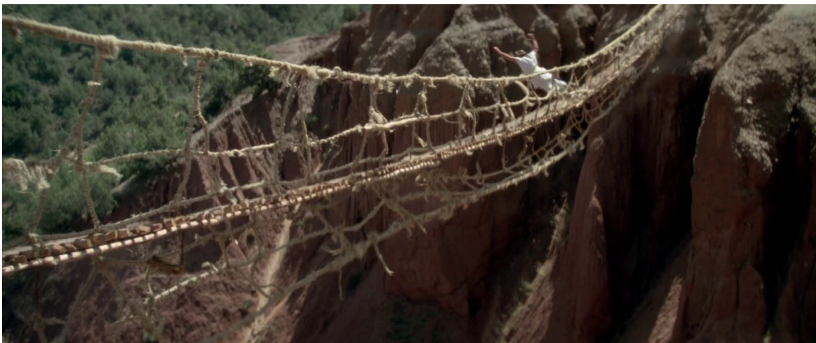
Figura 1. Tras ser descubierto el engaño, Dravot es obligado por los indígenas a cruzar el puente de cuerda, que es inmediatamente destruido.

hecho de que su empresa se salde con un rotundo fracaso, muy bien condensado en la destrucción del puente de cuerda, construido bajo la dirección de Carnehan, y la caída de Dravot mientras lo está atravesando (figura 1), invita a reflexionar sobre la naturaleza y el fundamento de cualquier misión civilizadora, pasada o presente. Este debate se podría retomar en diferentes momentos del curso, referido incluso al reciente fracaso de la ocupación norteamericana en Afganistán tras el 11S para dismantelar el poder talibán (2001-2021) (figura 2). Es más, el hecho de que en la primera parte de la película se muestren con claridad las mejoras introducidas por la presencia británica en la India y más adelante la intención de los protagonistas de reproducirlas en Kafiristán (especialmente cuando Dravot decide quedarse allí y fundar una dinastía) ayudará al profesorado a desplegar el concepto mismo de misión civilizadora en el aula, de cara a desterrar la asociación entre tiranía e imperialismo que suele establecer habitualmente el alumnado de cuarto de la ESO e incluso de bachillerato 10 .