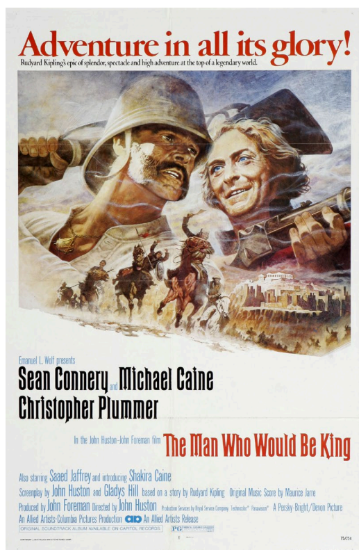
Figura 3. Carteles promocionales originales de El hombre que pudo reinar .

En el caso de El hombre que pudo reinar se optó por un dibujo elaborado a partir de un collage de tres fotogramas de la película: un plano medio de los dos protagonistas agarrando un rifle y dos planos generales situados delante de ellos, uno del campo de batalla y otro de la ciudad sagrada de Sikander (figura 3). En la parte superior, en letras rojas (el fondo del cartel es blanco) aparece la frase promocional “Adventure in all its glory!”, acompañada de una referencia al origen literario de la película, identificando a su autor: Rudyard Kipling. Otra frase promocional que también se empleó fue: “Long live Adventure... and Adventurers!”. Evidentemente, si no se ha visto la película o leído el relato se desconocerán muchos de estos elementos, el alumnado ni siquiera sabrá quién es Kipling; pero a pesar de todo ello, cualquiera que observe el cartel identificará el film como una historia de aventuras que se desarrolla en algún paraje exótico del pasado. Los rifles y la escena de batalla no solo aluden a la aventura, sino también a la conquista, a la guerra, fase previa a la colonización. Conviene pues interrogar al alumnado en torno a lo que le sugiere el cartel en esta primera fase, dedicándole especial atención a la reflexión específica sobre el título: ¿a quién se refiere?, ¿qué nos quiere decir?, ¿qué información aporta y cómo condiciona al resto de los elementos visuales y textuales del cartel?