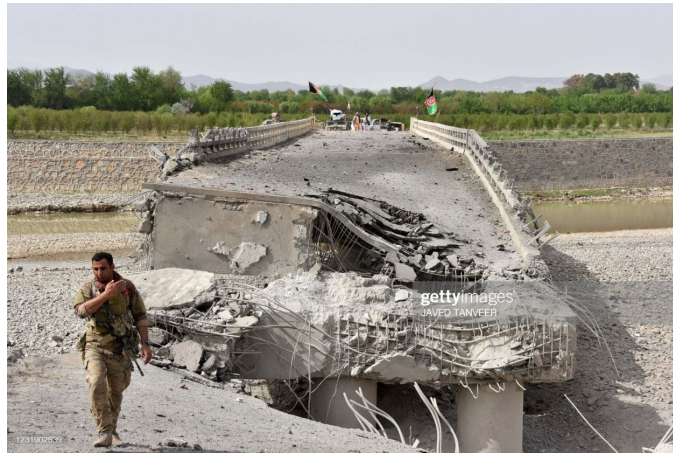
Figura 2. Un soldado camina cerca del puente que conectaba la ciudad de Kandahar y el distrito de Arghandab tras haber sido destruido por los talibanes en marzo de 2021.