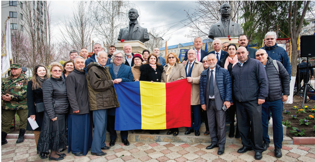
Fig. 6. Delegația buzoiană prezentă la inaugurarea ansamblului monumental inaugurat la Ialoveni, 27 martie 2023.

populația, și politicienii de pe ambele maluri ale Prutului să înțeleagă acest lucru.