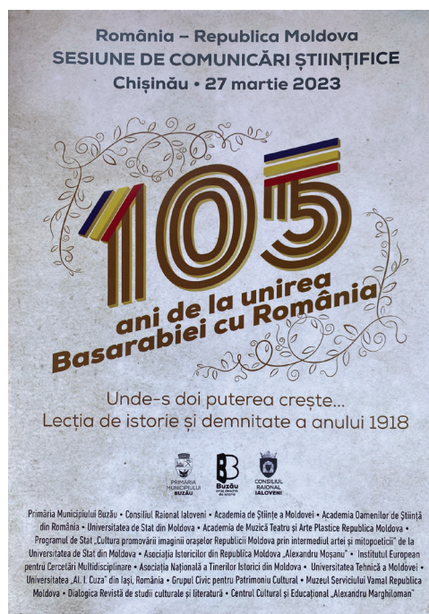
Fig. 5. Afiș al sesiunii de comunicări „Unde-s doi puterea crește... Lecție de istorie și demnitate a anului 1918”, Chișinău, 27 martie 2023.

M-AN: Sunt buzoian get-beget și, prin sprijinul familiei am avut parte de o educație completă, militară – de aviator, iar civilă – de istoric, ceea ce mă ajută acum în mod evident. Ca locuitor al orașului Buzău, mărturisesc că iubesc enorm acest oraș, cum de altfel mi-e extrem de