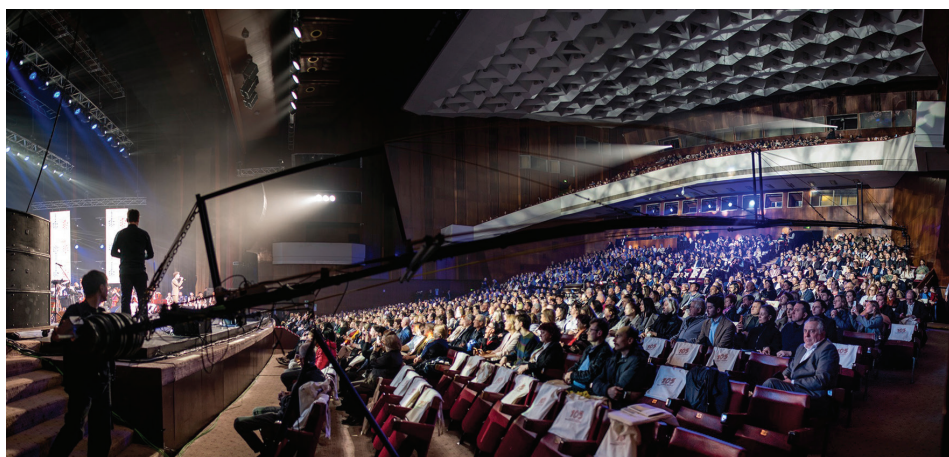
Fig. 8. Imagine de la spectacolul „Limba română este Patria mea”.

LC: Apropo de titlul conferinței. De unde vine? Pe 27 martie 2023 am recapitulat cu toții, pe ambele maluri ale Prutului, adevărata lecție de istorie și demnitate pe care ne-au oferit-o, prin sacrificiul lor, străbunii noștri, în martie 1918. Majoritatea au avut un destin tragic, uitatea fiind cea mai dură, când ani la rândul nu-