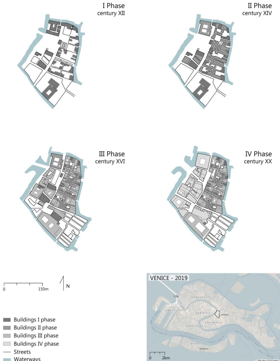
Figura 2. Região de São Bartolomeu – Veneza: evolução urbana (fonte: Muratori, S. (1959); Google Maps (2019); redesenhado por: Schiavo, P., 2019)

de São Bartolomeu, perto da Praça de São Marcos, em Veneza. Neste mapa, pode-se observar a construção sucessiva de tipos originais e a fixação da forma urbana, desde o século XI até 1960. A notável semelhança entre as duas obras pode ser considerada uma coincidência ou uma raiz comum enigmática que pode ser interpretada como um caso de sincronicidade (Figura 2).