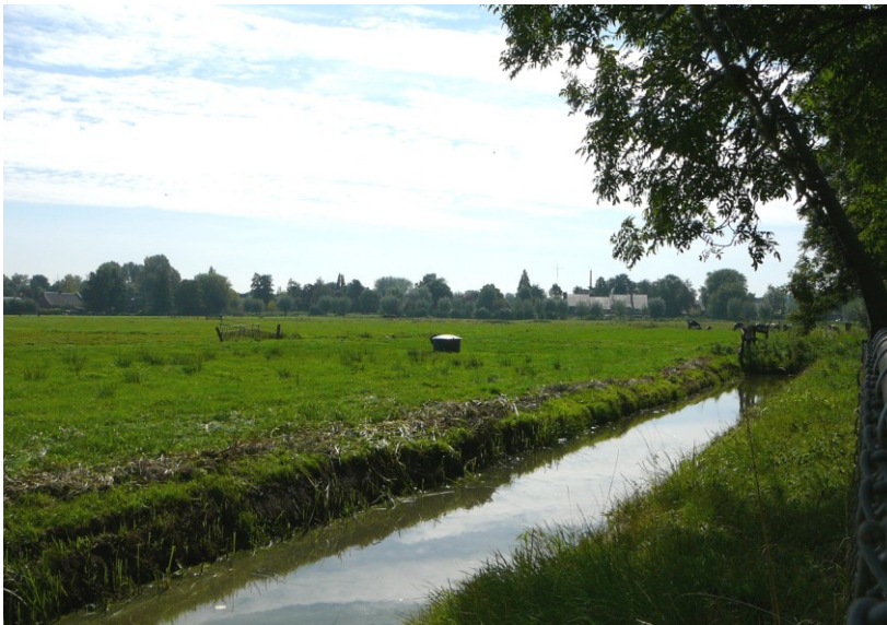
Foto 2 Wingebied grondwater