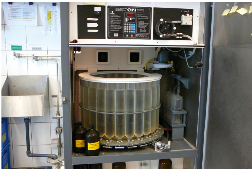
Foto 4 Biomonitor bij innamepunt oppervlaktewater

De bedrijven die oppervlaktewater gebruiken zijn goed voorbereid op calamiteiten. Ze zijn aangesloten op het alarmeringsysteem van Rijkswaterstaat, ze beschikken over biomonitoren bij de inlaat (foto 4) en er zijn permanente meetstations bij Lobith en Eysden. De informatie vanuit deze systemen in combinatie met de innamecriteria zorgen ervoor dat er tijdig een besluit genomen kan worden om de inname te stoppen. Vanzelfsprekend beschikken de bedrijven over procedures en afspraken met waterbeheerders hoe te handelen in een dergelijke situatie inclusief de communicatie daarover. De leveringszekerheid is gewaarborgd door de beschikbaarheid van voorraden in de duinen, spaarbekkens en de inzet van grondwater bij de locaties Lekkanaal (Waternet) en Heel (WML).