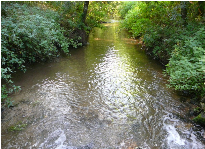
Foto 2 Infiltratie van oppervlaktewater in waterwingebied geeft risico's voor de microbiologische veiligheid van het onttrokken grondwater.

De meeste bedrijven zijn bezorgd over de mogelijke aanwezigheid van WKO-installaties in het intrekgebied of beschermingsgebied. De provincies staan zogenoemde open WKO's niet toe in deze gebieden, maar soms worden er uitzonderingen gemaakt en wordt er ontheffing verleend. Bedrijven geven aan dat WKO-installaties die bij de provincies zijn gemeld ook bij hen bekend zijn. Veelal is er geen informatie over de aanwezigheid van gesloten systemen. Voor de aanleg van gesloten systemen is geen toestemming van de provincie nodig.