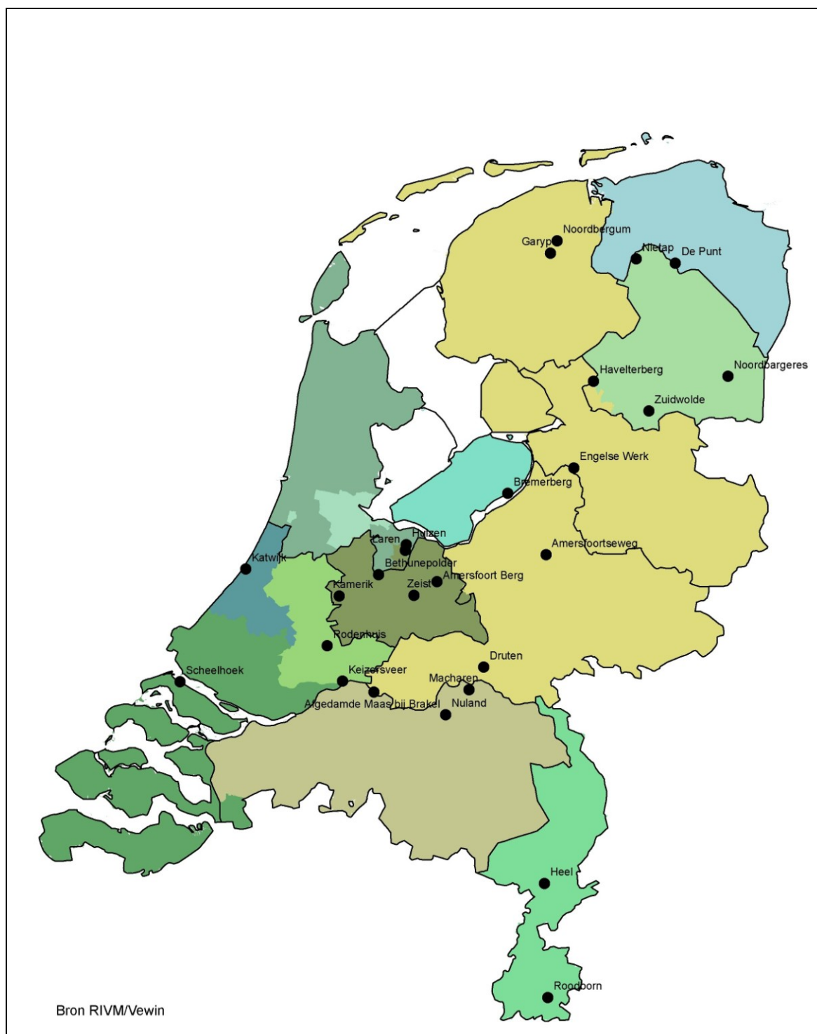
Figuur 2.1 De winningen die tijdens het onderzoek zijn bezocht.