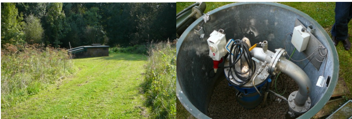
Foto 1 Winput in een waterwingebied en bovenaanzicht winput.

In bijlage I is per bedrijf een beschrijving gegeven van de bevindingen per bezochte locatie.