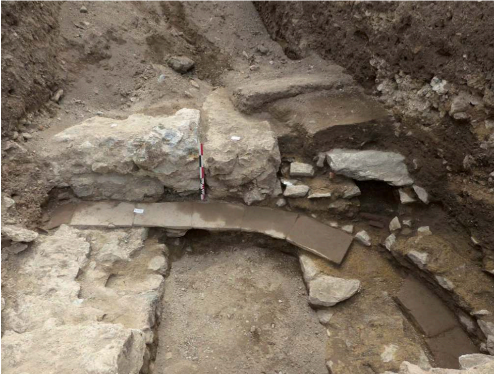
Fig. 2 – Sondage 4