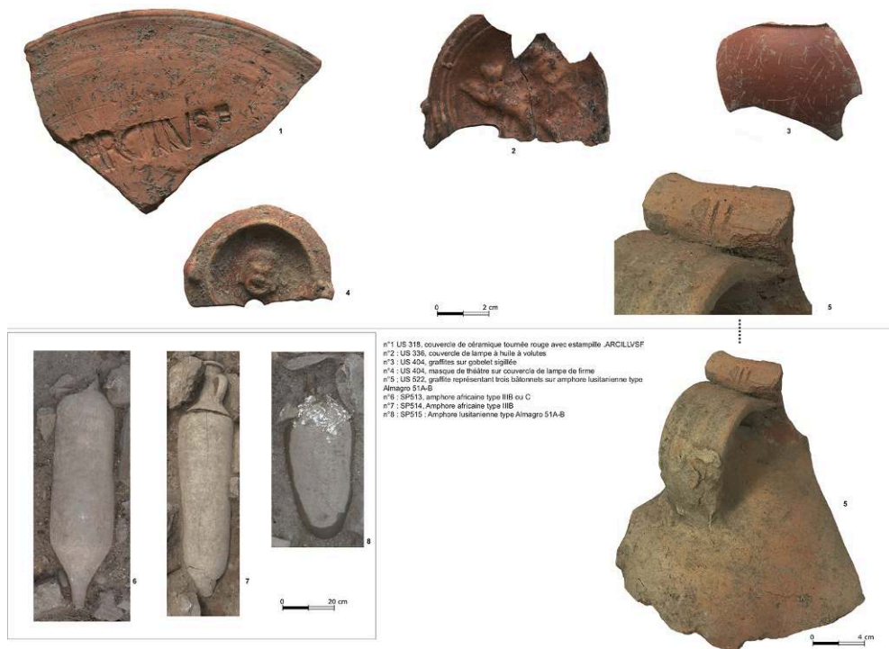
Clichés : C. Bonnet et équipe de fouille ; DAO : D. Frascione (Inrap).