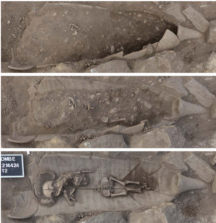
DAO : J. Blanco (Inrap).