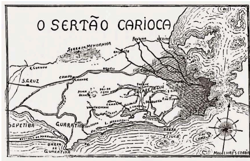
Figura 2. Mapa do “sertão carioca”. Gravura a bico de pena feita por Magalhães Corrêa (2017, p. 52).

“Sertão carioca” foi a denominação atribuída à antiga zona rural da cidade do Rio de Janeiro por Armando Magalhães Corrêa, autor do livro homônimo publicado em 1936 e reeditado pela Biblioteca Nacional com a editora Contra Capa em 2017. O livro de Corrêa é um registro histórico do campesinato e das práticas agrícolas levadas a cabo na Zona Oeste do Rio de Janeiro, como o cultivo da banana, a produção de carvão e a pesca, entre outras atividades ligadas ao extrativismo ou dependentes dos recursos naturais da região.