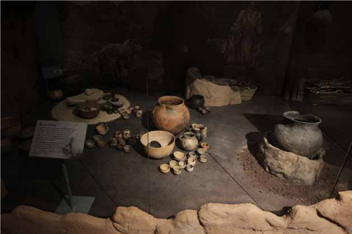
Fig. 7. Detalle de la recreación de una habitación de la Lloma de Betxí (Paterna) en la exposición temporal «Vivir junto al Turia hace 4000 años», 2014-2015.