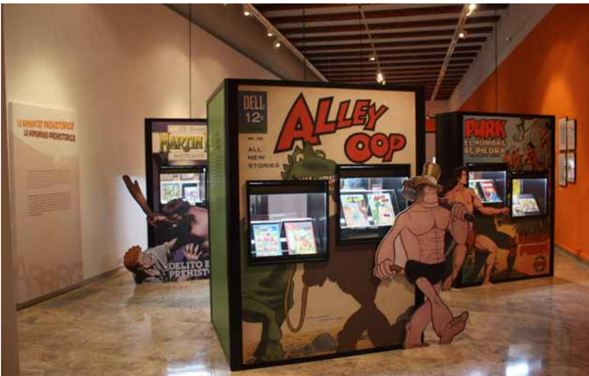
Fig. 8. Vista de la exposición temporal «Prehistoria y cómic», 2016.