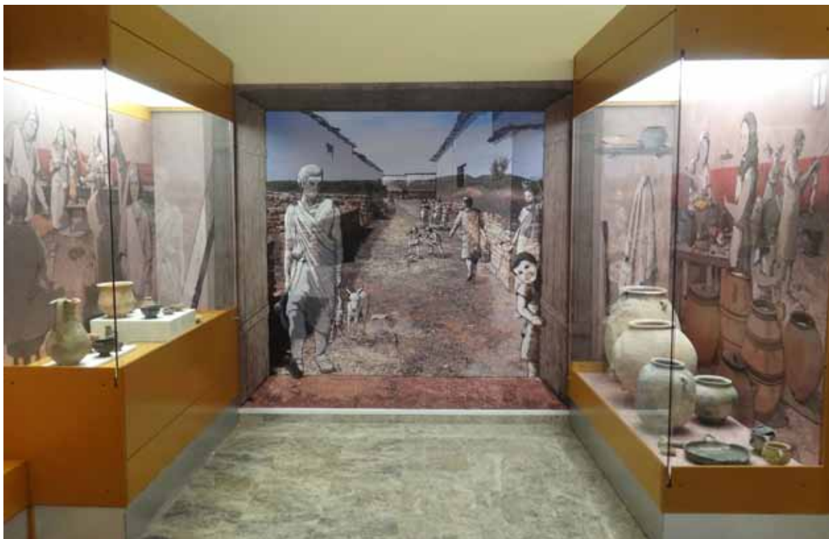
Fig. 4. Reciente remodelación de las vitrinas de Kelin (Caudete de las Fuentes) dedicadas a la comensalidad y a la cocina ibérica.