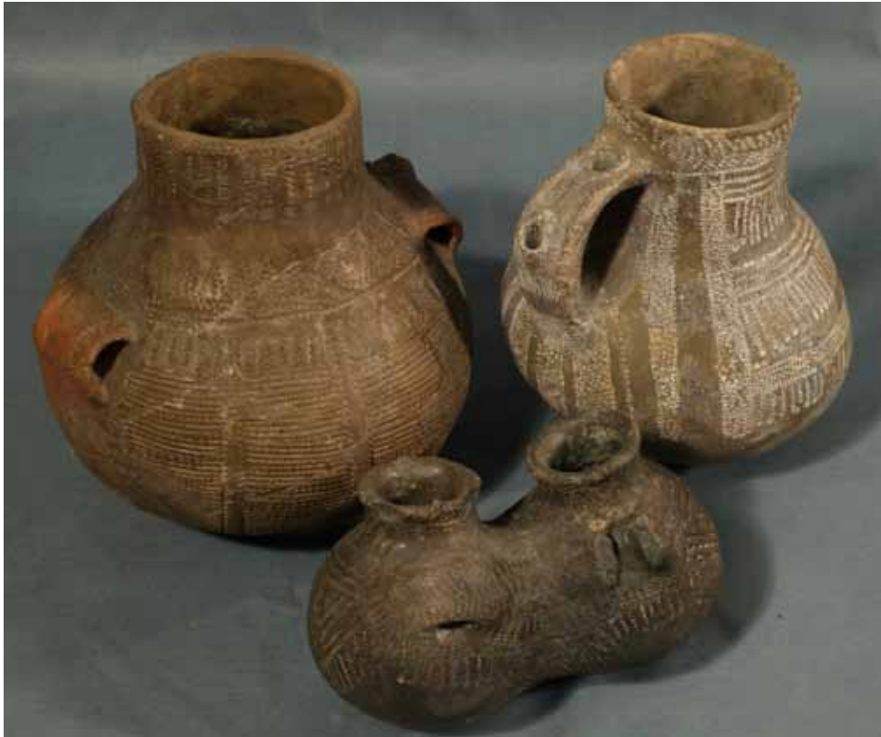
Fig. 2. Vasos neolíticos con decoración cardial de la Cova de l'Or (Beniarrés).

hablar del arte paleolítico y presentar las plaquetas decoradas de la Cova del Parpalló. Intercalados a lo largo de estas salas se ofrecen diversos espacios destinados a audiovisuales. Se presentan aquí aislados, separados de los objetos y del resto de los recursos utilizados, y suponen una ruptura en el circuito de la visita, por lo que se convierten en áreas de descanso, que son aprovechadas para presentar la biblioteca infantil y llevar a cabo actividades didácticas. Éstas, guiadas y autoguiadas, vienen a ofrecer claves de lectura diversa, temática y transversal de estas salas, que refuerzan la interacción efectiva del personal del Museo con el visitante.