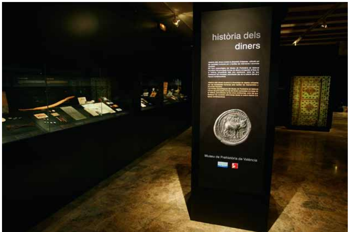
Fig. 6. Vista general de la sala de «Historia del dinero».

educativa y cultural de la sociedad valenciana. Los instrumentos utilizados para afrontar estos retos son las exposiciones temporales e itinerantes y las actividades que coordinan el SIP y la Unidad de difusión, didáctica y exposiciones. Las exposiciones temporales responden a un programa anual en el que, al menos una de ellas, es de producción propia orientada a presentar las colecciones y a abordar problemáticas actuales de interés social y cultural, y aproximar la prehistoria a la sociedad desde nuevas perspectivas. Buena expresión de ello son las exposiciones resultado de proyectos de investigación en marcha, como «Vivir junto al Turia hace 4000 años» (De Pedro; Ripollés, y Fortea, 2015), sobre el yacimiento de la Lloma de Betxí o «Un mundo de fieras» (Sanchís, 2015), a partir del hallazgo de un esqueleto de leopardo del Pleistoceno en el Avenc de Joan Guitón (Fontanars dels Alforins). La serie de exposiciones temporales titulada «Tresors del Museu de Prehistòria» presenta piezas o colecciones relevantes no siempre expuestas (Pascual, 2012; Vives-Ferrándiz, 2013) o nuevas adquisiciones (Gozalbes, y Sánchez, 2014); más novedosas son las recientes exposiciones de temática transversal como «Mundos tribales» (Salazar et alii , op. cit. ), «Prehistoria y cine» (Jardón; Pérez, y Soler, 2012), o «Prehistoria y cómic» (Bonet, y Pons, 2016).