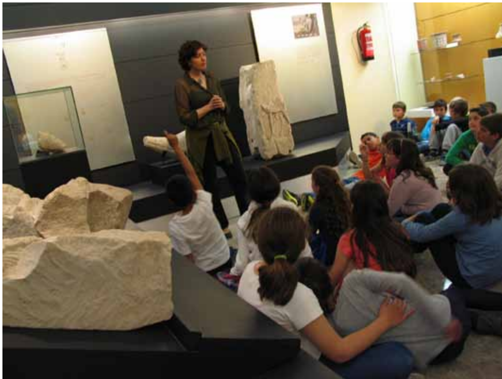
Fig. 9. Visita guiada en la salas de la cultura ibérica con alumnado de Primaria, 2014.

«Restos de vida, restos de muerte», que muestra la relación que el ser humano ha establecido con la muerte desde los albores de la humanidad (Pérez, y Soler, 2010). También las maletas didácticas, concebidas como verdaderas exposiciones interactivas, cumplen la triple misión de difundir el patrimonio arqueológico, participar en el desarrollo cultural local y dar a conocer la labor del Museo.