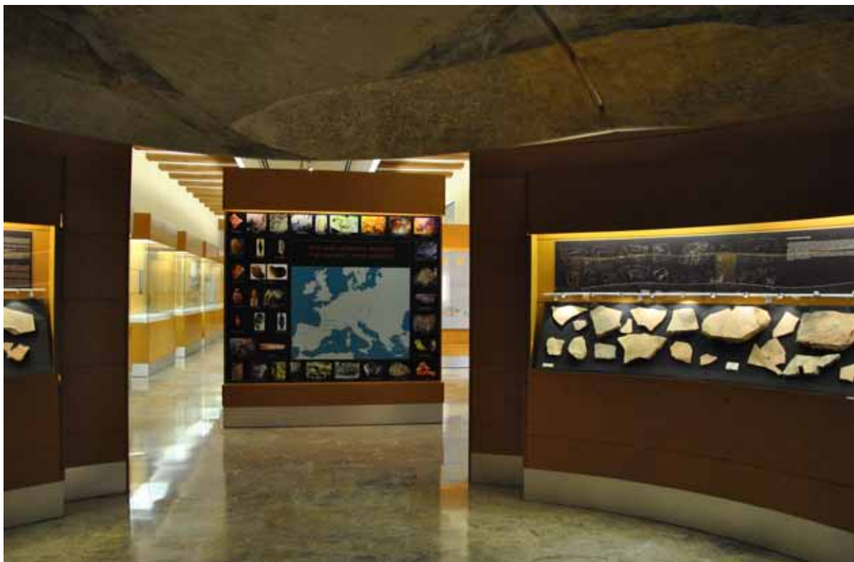
Fig. 3. Sala dedicada a las plaquetas grabadas del Paleolítico Superior de la Cova del Parpalló (Gandía).