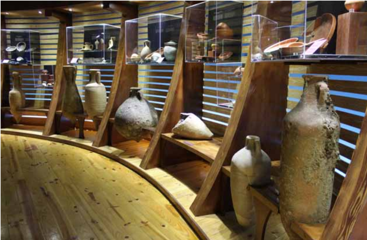
Fig. 5. Detalle del ámbito dedicado al comercio en las salas del «Mundo romano».

tierras valencianas, gira en torno a un gran video introductorio y el magnífico mosaico de Los orígenes de Roma de Font de Mussa. En la sala dedicada al comercio se presenta la escenografía de un pecio y una evocadora ambientación de las bodegas de un barco mercante en la que se exponen los principales productos objeto de intercambio en la época. De entre las siguientes salas dedicadas el mundo urbano y rural, el mundo funerario y a la época visigoda, adquiere un papel central la magnífica escultura en bronce del Apolo de Pinedo. Se incluyeron en este proyecto mecanismos y equipamientos para la interacción asociados a unidades de información de cada ámbito, que permiten la manipulación física como recurso didáctico, maquetas, cajones con réplicas y juegos interactivos.