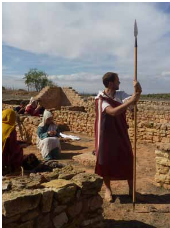
Fig. 10. Jornadas de puertas abiertas en la ciudad ibérica de Kelin , 2015.