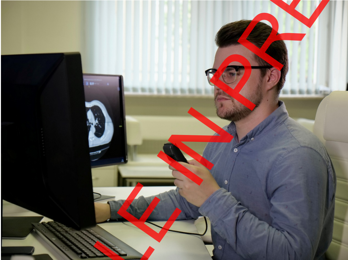
Рис. 2. Рабочее место врача-рентгенолога в Московском референс-центре лучевой диагностики, оснащённое системой распознавания речи. Процесс заполнения медицинской документации.