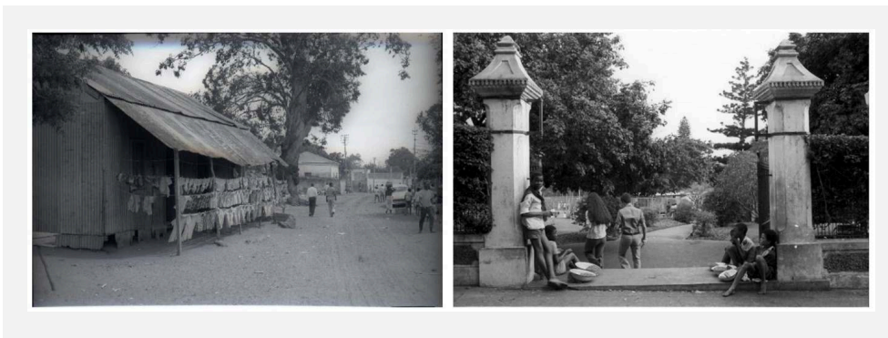
FIGURA 10. Bairro do Xipamanine. Lourenço Marques (Maputo), anos 1960. Referência: RR02_01_B_01.