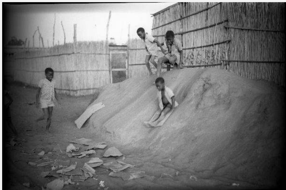
FIGURA 3. Crianças brincando. Lourenço Marques (Maputo), anos 1960.