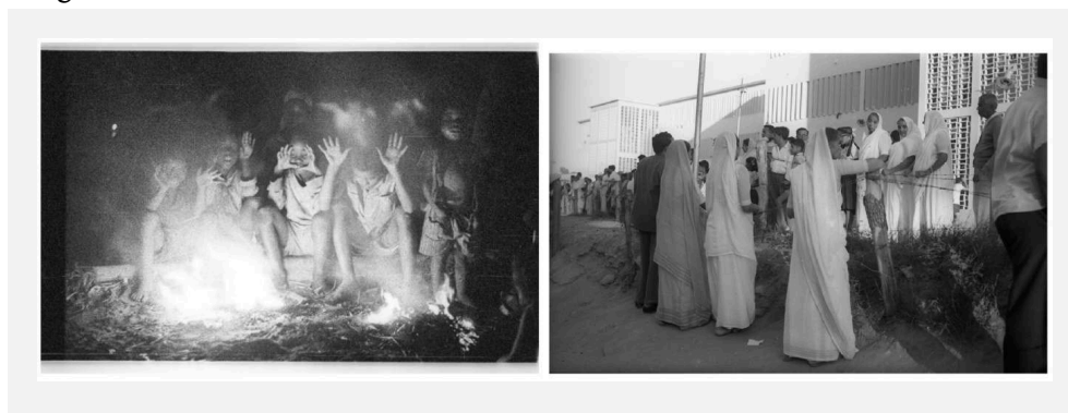
FIGURA 8. Noites de julho na Mafalala. Lourenço Marques (Maputo), 1960.