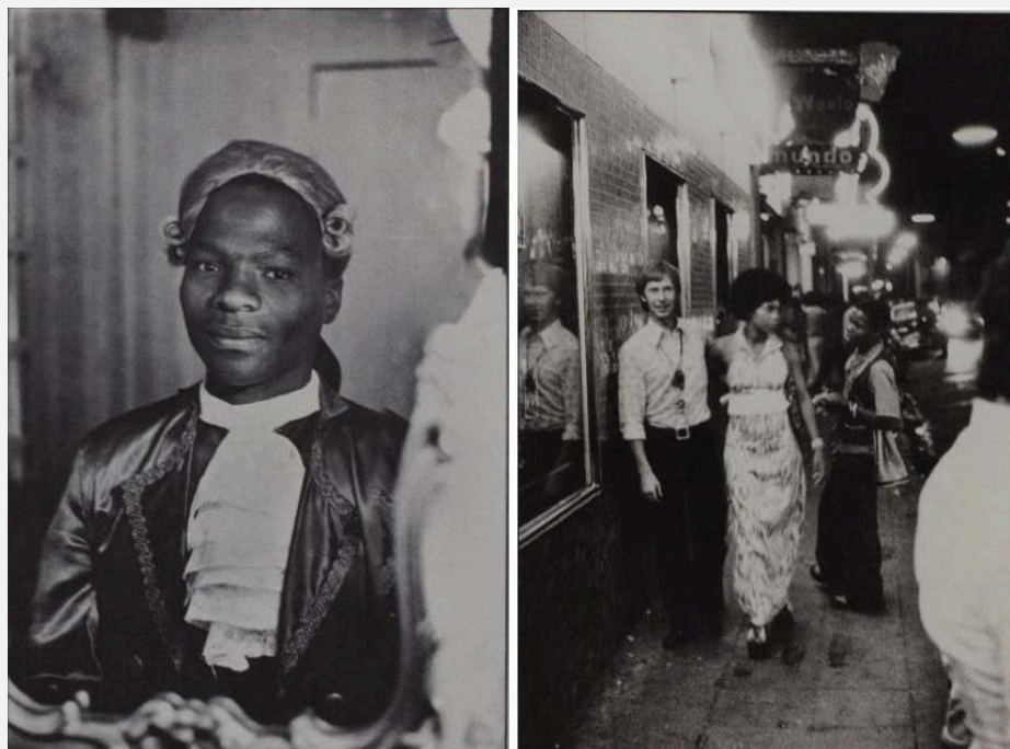
FIGURA 5. Paradoxo do contexto. Porteiro do cabaré Moulin Rouge. Beira, 1964.