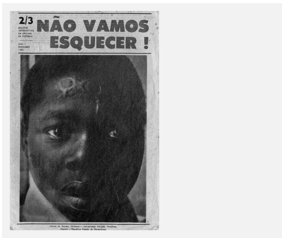
FIGURA 1. Ferro em brasa . Changalane, 1972.