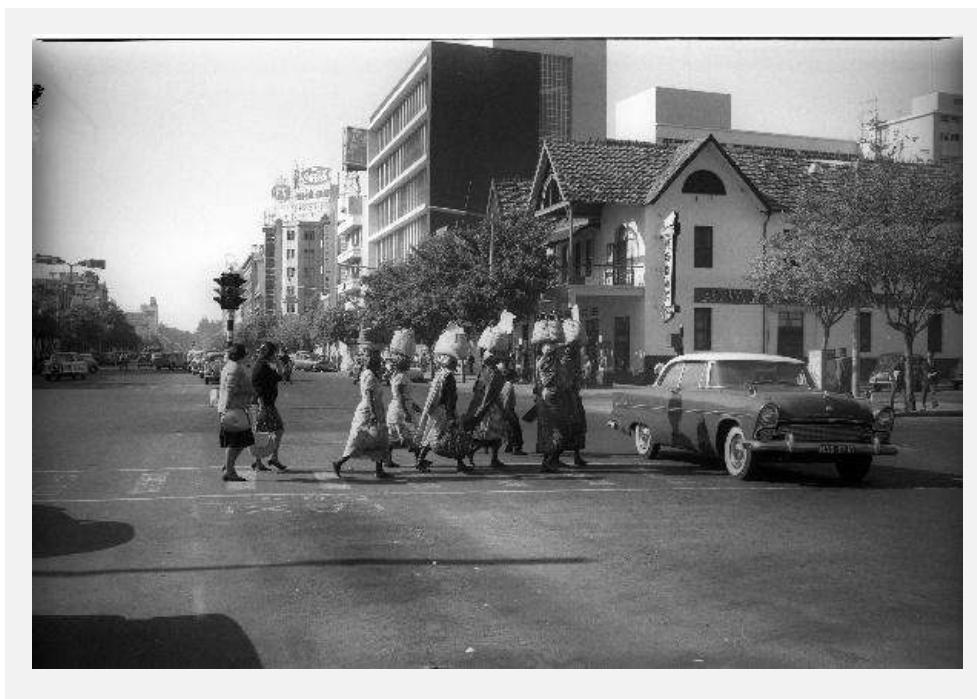
FIGURA 4. Mulheres atravessando a rua. Lourenço Marques (Maputo), anos 1960. Referência: RR02_08_C_01.