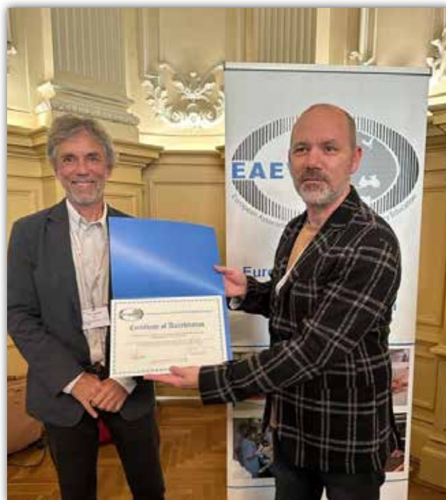
Slika 1. Certifikat kojim se dokazuje da je VEFUNIZG akreditirana članica EAEVE-a

Fakultet je, stoga, uložio izniman napor kako bi zadržao status akreditirane ustanove, u čemu je u konačnici, na veliko zadovoljstvo Uprave i svih zaposlenika, studenata i vanjskih dionika, uspio.