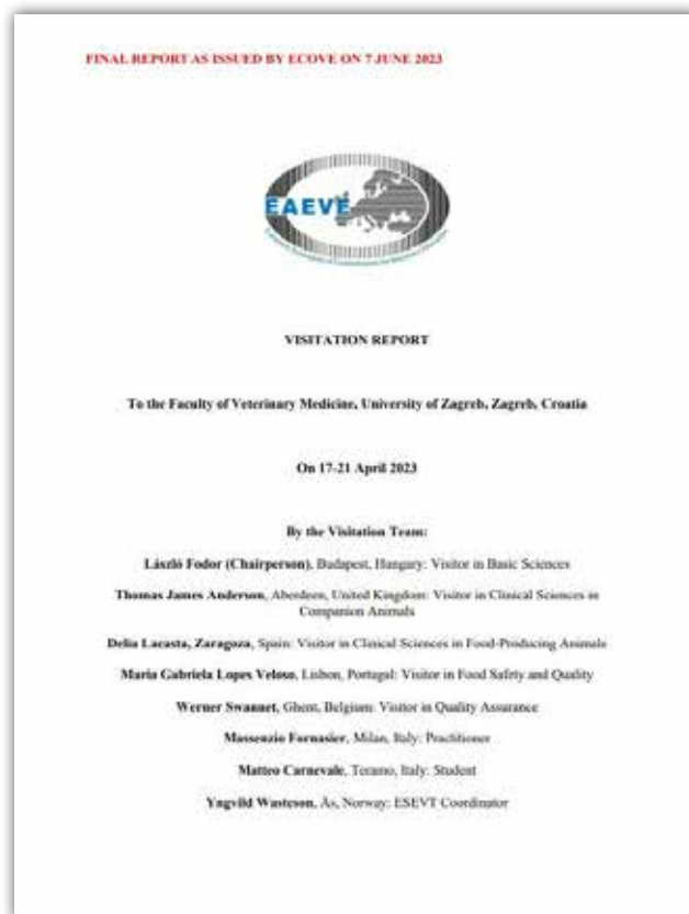
Slika 4. Konačno izvješće vizitacijskog tima o rezultatima ESEVT potpunog vizitacijskog postupka (od 7. lipnja 2023.) ( Visitation Report – Final Report as Issued by ECOVE on 7 June 2023. )

Cjelokupni posjet, među ostalim, temelji se i na detaljnoj provjeri usuglašenosti onoga što je navedeno i opisano u SER-u i onoga što je bilo moguće uočiti tijekom tjedna u kojemu je vizitacijski tim posjetio