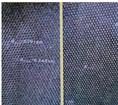
Prve slike linijskog i atomskog razlučivanja, dobivene na elektronskom mikroskopu, na uzorku korunda \text{Al}_2\text{O}_3 (Fizički odsjek 1993.). Bijele točkice su, jednostavno rečeno, slike \text{Al}_2\text{O}_3 . Vide se razlučene ravnine d_{229} = 0.191 \text{ nm} , d_{225} = 0.240 \text{ nm} .

Kao jedina u Hrvatskoj bavila sam se eksperimentalnim radom iz elektronske mikroskopije visokog razlučivanja (HRTEM) na mikroskopu instaliranom u Hrvatskoj. Treba uočiti da bez korištenja TEM-a i HRTEM-a usporedo s elektronskom difrakcijom (ED), nije moguće razumjeti vezu između struktura i fizikalnih svojstava nanomaterijala, koji su osobito važni u suvremenoj znanosti i tehnologiji. Upravo na području nanomaterijala, posebno na području nanokristalnih metalnih oksida, važnih za primjenu kao oksidi \text{Al}_2\text{O}_3 , \text{TiO}_2 , \text{ZrO}_2 (čisti i dopirani) ostvarila sam najznačajnije rezultate.