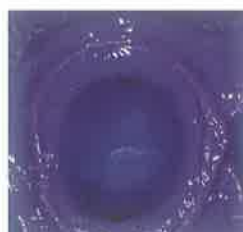
Slika 8. Polieter