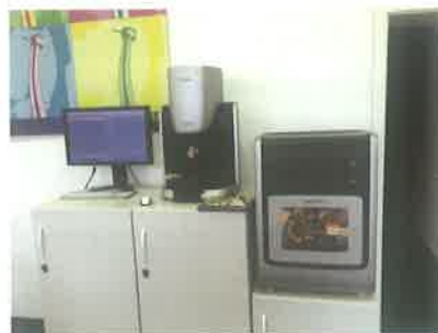
Slika 2. Skeniranje u laboratorijskom skeneru „in-Lab“ (Sirona, Njemačka)