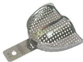
Slika 5. Konfekcijska žlica