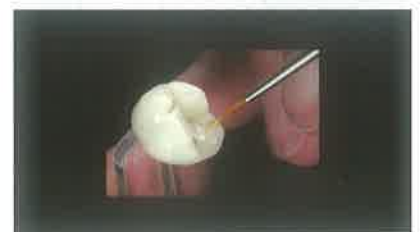
Slika 9. Tehnika bojanja