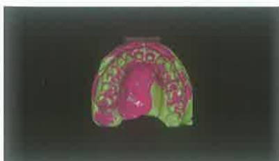
Slika 7. Dvovremeni otisak

Uz do sada navedene argumente može se dobiti dojam da digitalni otisci imaju prednost nad konvencionalnim, no odnos se relativno mijenja kada se postavi pitanje otiskivanja subgingivnih preparacija. Naime, digitalni otisci zahtijevaju da cijeli marginalni rub preparacije bude izložen i vidljiv uz 0,5 mm tvrdog zubnog tkiva apikalno od marginalog ruba. Na taj način možemo dobiti dobar profil prepariranog bataljka (4). Ipak, ukoliko postoje indikacije za subgingivnu preparaciju ne mora se odustajati od uzimanja digitalnog otiska i posezati za konvencionalnom tehnikom otiskivanja. U početne dijelove gingivalnih sulkusa postavljaju se retrakcijski konci i oslobađaju se prikazi završnih granica preparacije koji na taj način postaju dostupni 3D skeneru. Važno je prisjetiti se da tijekom izrade fiksnoprotetskog rada treba postupati parodontno-profilaktički, uz posebnu pažnju na očuvanje biološke širine. Zbog toga retrakcijski konac stavljamo u početni dio gingivnog sulkusa uz provjeru parodontom sondom da se ne ugrozi biološka širina sulkusa. Upravo se za subgingivno smještene rubove preparacije vjeruje da potencijalno remete biološku širinu i kao takvi potiču reakciju parodonta (5).