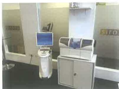
Slika 1. Ordinacijski sustav CEREC (Sirona, Njemačka)

Cilj ovog članka je prikazati usporedbu konvencionalnih i digitalnih intraoralnih otisnih postupaka u