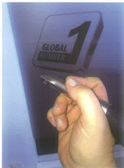
Slika 10. 3D intraoralni skener

No iskusni kliničari ipak spominju i nekoliko činjenica koje dovode u pitanje prednost digitalnih otisaka pred konvencionalnim kao što su primjena intraoralnog skenera kod pacijenata s trizmusom ili dostupnost distalnih ploha drugog i trećeg molara. Ova pitanja su vezana za