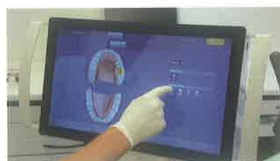
Slika 4. Skeniranje u ustima pacijenta i obilježavanje ruba preparacije (Apollo DI, Sirona, Njemačka)