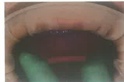
Slika 3. Otisak u individualnoj žlici u ustima