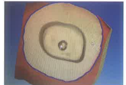
Slika 6. Označavanje rubova preparacije. Preuzeto iz (6)