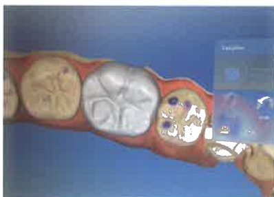
Slika 8. Dizajniranje nadomjestka. Preuzeto iz (6)