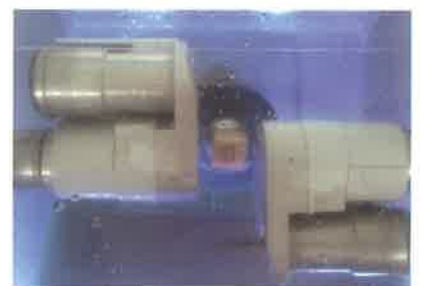
Slika 9. Aparat za glodanje. Preuzeto iz (6)