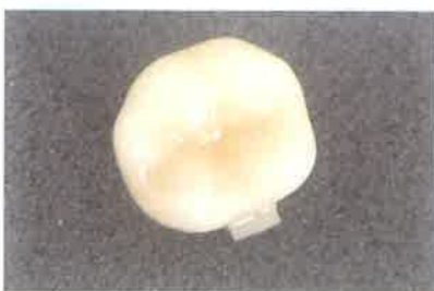
Slika 11. Gotov nadomjestak. Preuzeto iz (6)