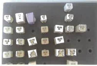
Slika 2. Blokovi za glodanje. Preuzeto iz (6)