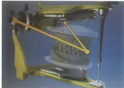
Slika 5. Virtualni artikulator. Preuzeto iz (6)