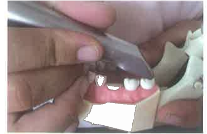
Slika 3. Intraoralna 3D kamera. Preuzeto iz (6)