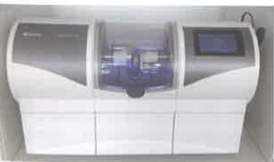
Slika 10. Glodanje. Preuzeto iz (6)