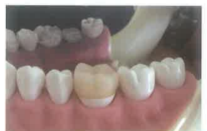
Slika 12. Dosjed nadomjestka na model. Preuzeto iz (6)