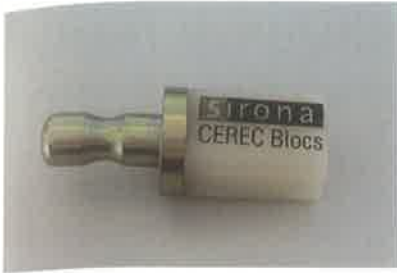
Slika 1. Blok za glodanje. Preuzeto iz (6)