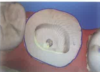
Slika 7. Označavanje podminiranih mjesta. Preuzeto iz (6)