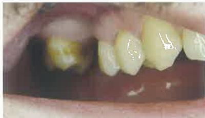
Slika 4. Kontrola preparacije