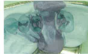
Slika 6. Otisak u žlici