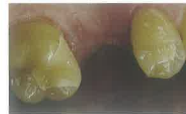
Slika 9. Privremeni nadomjesci za uporišne zube