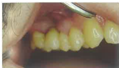
Slika 16. Gotovi most u ustima