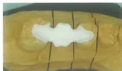
Slika 11. Skelet mosta na modelu