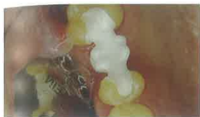
Slika 13. Dosjed na zub