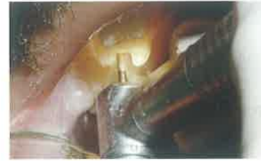
Slika 3. Brušenje uporišnih zuba