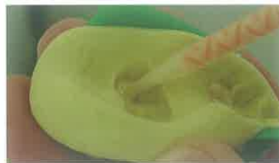
Slika 8. Otisak iz kondenzacijskog silikona (Optosil) za izradbu privremenog nadomjeska i unošenje materijala za privremeni nadomjestak