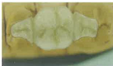
Slika 14. Gotovi most na radnom modelu