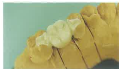
Slika 15. Most na radnom modelu