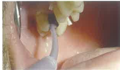
Slika 5. Otisak