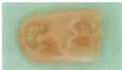
Slika 7. Međučeljusni voštani registar