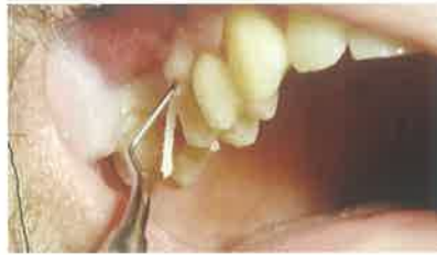
Slika 2. Postavljanje retrakcijskog končića prije brušenja