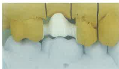
Slika 10. Cirkonijoksid na modelu