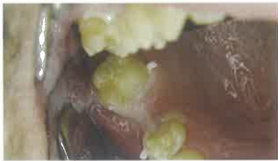
Slika 1. Početna situacija u ustima pacijenta

Završna faza je nanošenje kompozitnog cementa na retencijske površine nadomjeska i stijenke kaviteta te polimerizacija svake plohe, od početnih aproksimalnih do završnih okluzalnih.