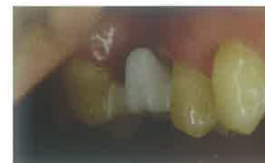
Slika 12. Proba tijela mosta