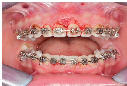
Slika 5. Prikaz postoperativnog stanja istog pacijenta odmah nakon provedene gingivektomije diodnim laserom