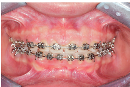
Slika 4. Predoperativno stanje hiperplazije gingive kod pacijenta s ortodontskim aparatom koja je izražena u području fronte

Gingivektomija je kirurški postupak kojeg je prvi opisao Robiscek 1884. godine. Cilj je zahvata uklanjanje gingivalnog džepa, što pripada resektivnoj kirurgiji, ali i postupak kojim se može produžiti klinička kruna i prikazati rub krunice ili kavite-ta, što su značajke mukogingivne kirurgije. Postupak se može obavljati skalpelom, laserom ili elektrokauterom, a danas je najčešći kirurški način zbrinjavanja hiperplazije gingive (5, 13). Gingivektomija se izvodi kada je tkivo mekano i teško za manipulaciju, ali samo u slučaju da je prisutno dovoljno pričvrzne gingive te se ne smije narušiti biološka širina (2, 5). Gingivektomija laserom (Slika 4., 5. i 6.) ili elektrokauterom je ugodnija pacijentu jer uzrokuje manju bolnost, ubrzava postupak, te se postiže trenutna hemostaza. Od lasera za gingivektomiju najčešće se koristi diodni laser, no i drugi laseri koji se koriste u dentalnoj medicini imaju isti terapijski slijed. Upotreba lasera ima nekoliko prednosti pri korištenju u mekom tkivu. Uzrokuje manja krvarenja, proizvodi najmanju bol, ima najmanju sklonost za razvoj infekcija ili stvaranje ožiljaka (14). Pri radu s elek-