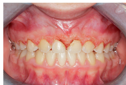
Slika 3. Prikaz stanja nakon izvršene gingivektomije diodnim laserom