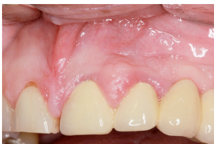
Slika 1. Prikaz hiperplazije gingive koja je lokalizirana interdentalno s vidljivim znakovima upale poput promjene boje, konzistencije tkiva, prisutnog krvarenja i povećanja volumena gingive

Upalna povećanja mogu biti akutna i kronična koja su češća. Kronična su većinom generalizirana stanja uzrokovana povećanom količinom plaka, neadekvatnim ispunom ili neprilagođenom protezom, ortodontskom terapijom (Slika 4.), disanjem na usta ili svim onim što može biti uzrok upalne reakcije. Kronične upalne promjene nastaju kao lagano uzdignuće interdentalne papile ili marginalne gingive koje uglavnom sporo progrediraju. Započinju kao minimalno povećanje koje se s vremenom može povećati u tolikoj mjeri da prekrije cijelu krunu zuba. Povećanje može biti lokalizirano ili generalizirano, a uglavnom je bezbolno, osim ako se ne razvije akutna infekcija ili trauma. Također kronično upalno povećanje može se javiti kao diskretno povećanje koje nalikuje na tumorsku masu (2,5). Akutna upalna sta-