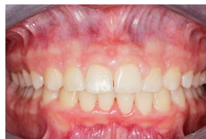
Slika 6. Prikaz postoperativnog stanja istog pacijenta nakon 6 mjeseci od provedene gingivektomije diodnim laserom, prije drugog korektivnog zahvata