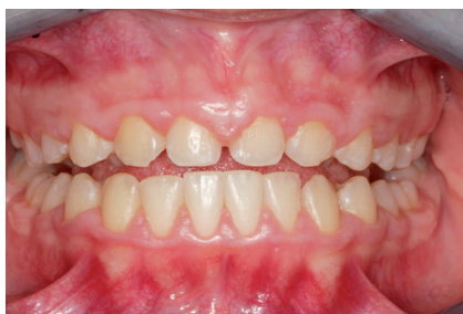
Slika 2. Prikaz difuzno proširene hiperplazije gingive izražene na vestibularnim i bukalnim ploham maksilarne gingive