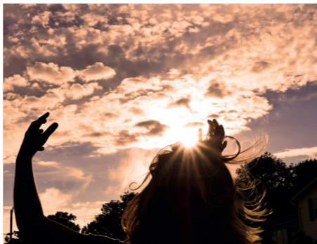
↑ Fig. 1. Becoming solar.