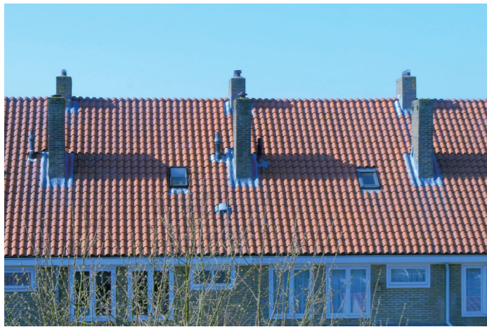
Fig. 7. "Chimney clocks".

at morning. I realised that the birds would wake me early rather than the sunrise itself. I started paying more attention to their habits and chirps and how they related to the sun. I noticed magpies regularly resting at the tops of trees around 3 pm.