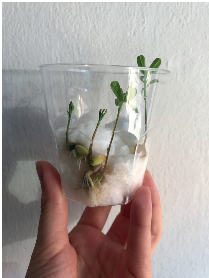
Fig. 8. Germinating lentil seeds in cotton.

She loved watching their roots grow, twist and shape around each other as if each plant was helping the other. Insects were attracted to them. At first, she would