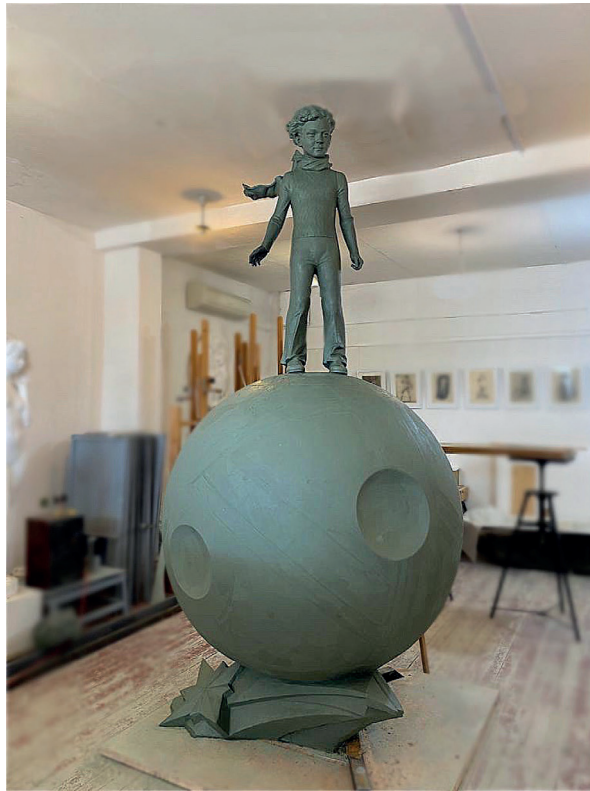
Рис. 1. Процесс лепки композиции «Маленький принц» в творческих мастерских скульптуры Российской академии художеств. 2022. Fig. 1. The process of modeling the composition "Little Prince" in the creative sculpture workshops of the Russian Academy of Arts. 2022.