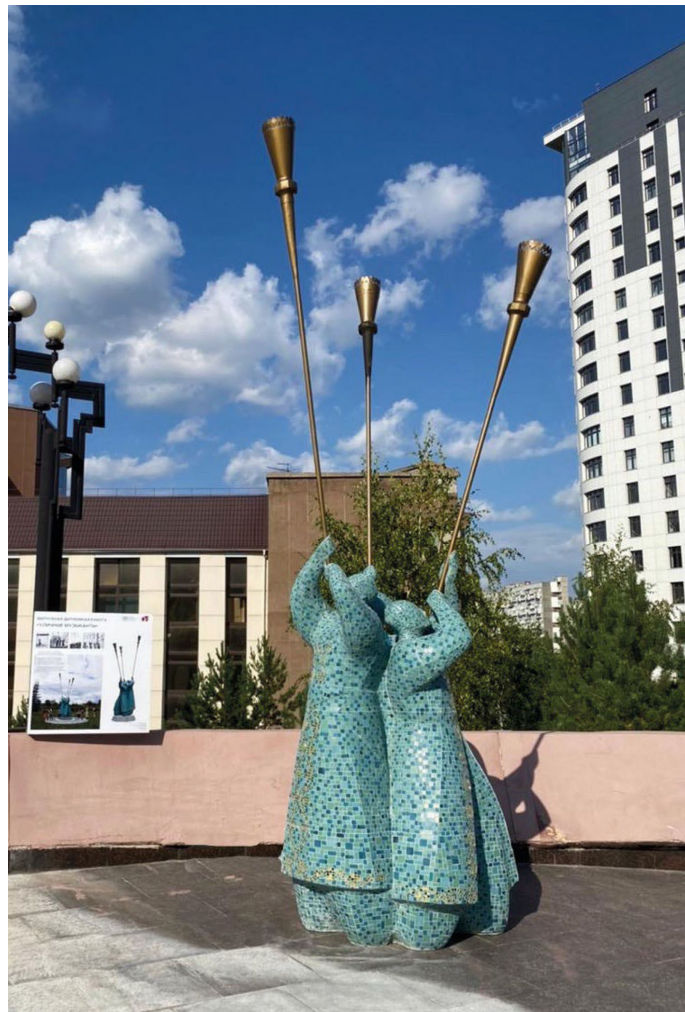
Рис. 5. Композиция «Уличные музыканты». 2022. Красноярск, Площадь искусств.