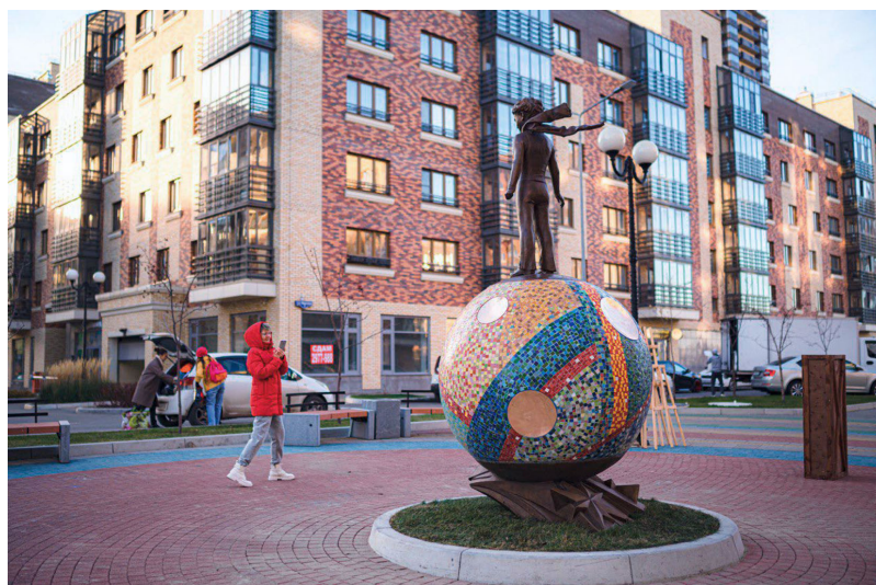
Рис. 3. Композиция «Маленький принц». Ракурс. 2022. Красноярск, улица Регатная, 4. Фото СМ. СИТИ Fig. 3. The composition "The Little Prince". Angle. 2022. Krasnoyarsk, Regatnaya Street, 4. SM. CITY