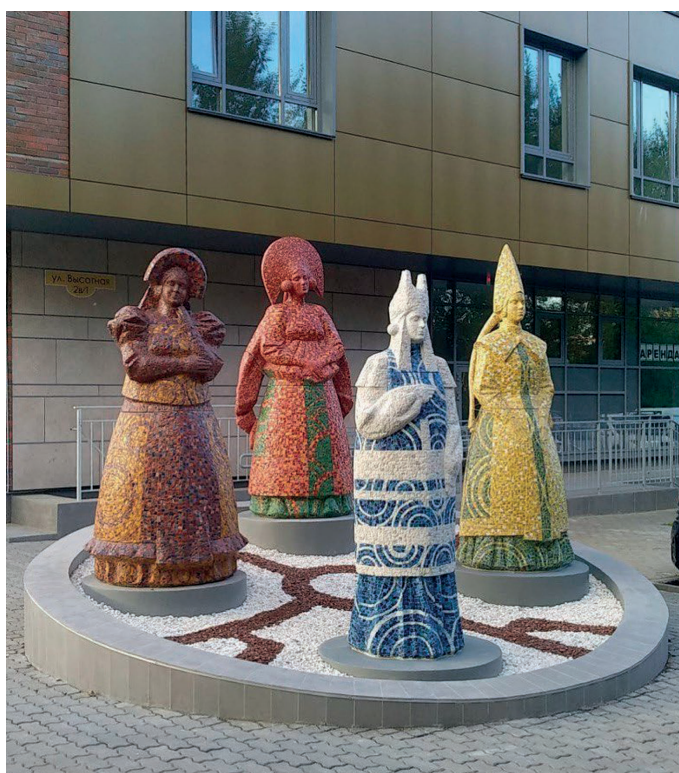
Рис. 4. Композиция «Времена года». 2020. Красноярск, творческие мастерские Союза художников России, улица Высотная 2В/1. Fig. 4. Composition "Seasons". 2020. Krasnoyarsk, creative workshops of the Union of Artists of Russia, 2B/1 Vysotnaya Street.