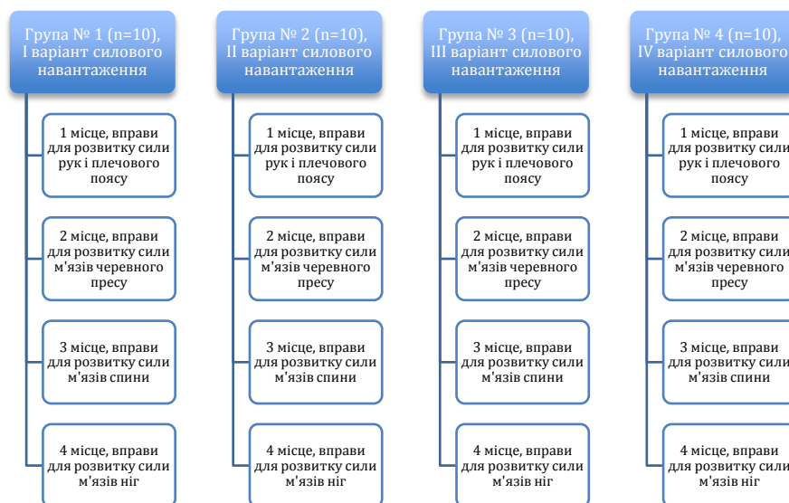
Рис. 1. Схема організації педагогічного експерименту

Для визначення динаміки тренувальних ефектів силових навантажень у дівчаток 7 років був проведений експеримент за планом наведеним в табл. 1. Варіант I комбінованого методу був реалізований для розвитку м'язів рук і плечового поясу (місце I), сили м'язів черевного пресу (місце II), сили м'язів спини (місце III) і сили м'язів ніг (місце). На кожному місці використовувалися такі методи: метод динамічних зусиль, метод максимальних зусиль, метод ізометричних зусиль, метод повторних зусиль. Режими виконання для кожної групи, для зазначених місць наведені у табл. 1 (див. табл. 1, рис. 1).