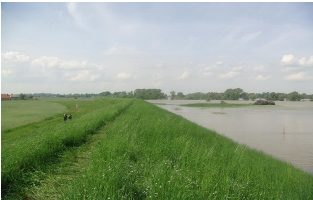
Fot. 5. Wał przeciwpowodziowy chroniący obszar Niziny Ciechocińskiej przed powodzią w maju/czerwcu 2010 roku. Międzywale porastają drzewa i krzewy.