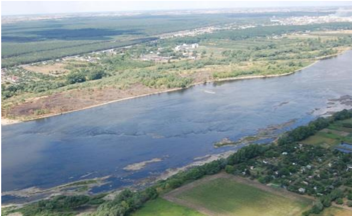
Fot. 6. Próg kamienno-gliniasto-ilasty na odcinku Wisły poniżej Zbiornika Włocławskiego, powstały w wyniku erozji wgłębnej i „usunięcia” aluwów rzecznych, całkowicie eliminujący transport wodny, sprzyjający tworzeniu się zatorów śrężowo-lodowych (fot. M. Habel, 2007).