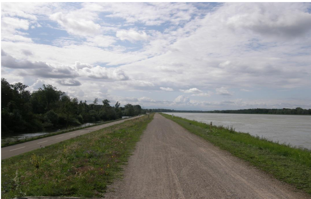
Fot. 4. Ren poniżej Strassburga z „czystą” powierzchnią międzywala i ekologicznym zawalem (lato 2014).