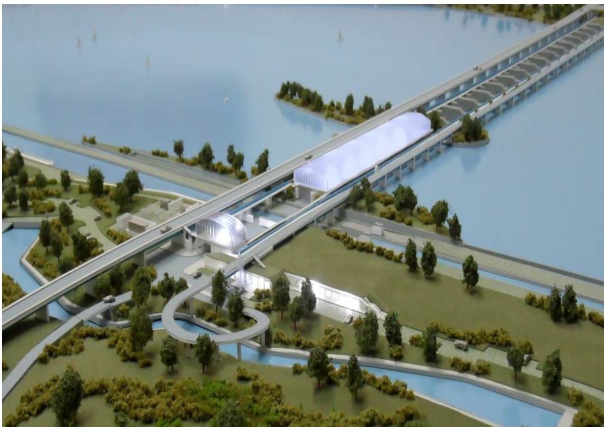
Fot. 3. Projekt planowanego II stopnia wodnego poniżej Zbiornika Włocławskiego (lewobrzeżny fragment z przeławką dla ryb)

Produkcja i wykorzystywanie energii stwarza od lat wiele problemów w różnych regionach świata. Dotyczy to w szczególności problemu wyczerpywania się nieodnawialnych źródeł surowców energetycznych. Przy obecnym poziomie eksploatacji – węgla kamiennego starczy prawie na 200 lat, węgla brunatnego na 290 lata, ropy na 40-45 lat, gazu na 56 lat. Tymczasem udział w produkcji energii elektrycznej na świecie, pochodzącej z elektrowni wodnych, stanowi zaledwie 2,7%. Porównanie obydwu danych, tj. czasu wyczerpania się zasobów nieodnawialnych źródeł energii na tle możliwości wykorzystania energetycznego wód, sugeruje podjęcie natychmiastowych decyzji co do pozyskiwania energii z tych ostatnich. Tymczasem, jak już wskazano wyżej, w Polsce nie planuje się do roku 2030 żadnych inwestycji hydroenergetycznych, wręcz, lobby ekologiczne mówi o tendencji odwrotnej, tj. o sukcesywnym wyeliminowywaniu hydroelektrowni i ich zbiorników (rozbiórka zapór) i nawrót do „naturalnego” biegu rzek (Babiński, Habel, 2013).