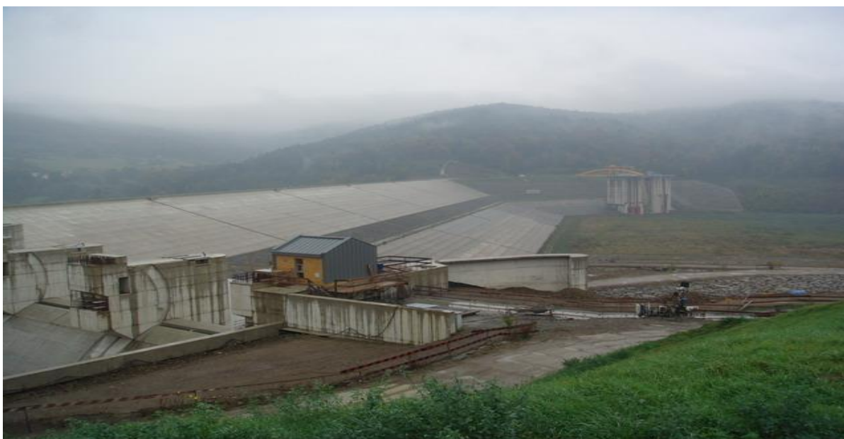
Fot. 2. Zapora Świnna - Poręba na dopływie górnej Wisły rzeki Skawa, której budowę rozpoczęto w roku 1986 i do dnia dzisiejszego nie zakończona. Na fotografii tzw. górne stanowisko stopnia z „suchym” zbiornikiem.