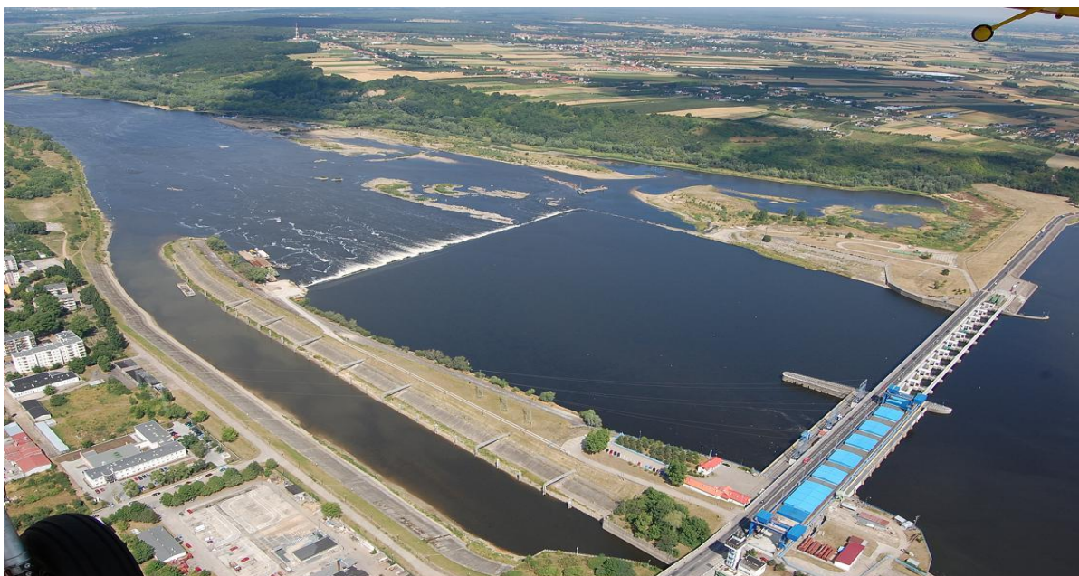
Fot. 1. Zapora ziemna na Wiśle Dolnej we Włocławku zbudowana w latach 1964-1968, o wysokości piętrzenia 11,3 m, obecnie, w wyniku procesu erozji wgłębnej ponad 15 m.