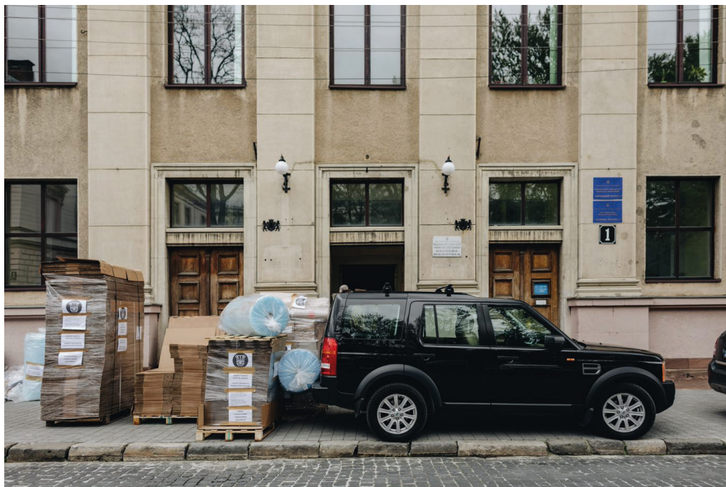
Il. 4. Odbiór transportu w Bibliotece Naukowej Politechniki Lwowskiej.