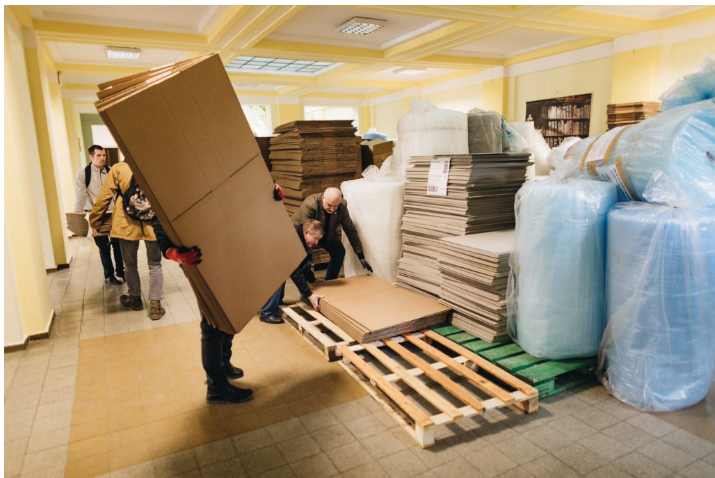
Il. 8. Odbiór transportu w Bibliotece Naukowej Politechniki Lwowskiej.