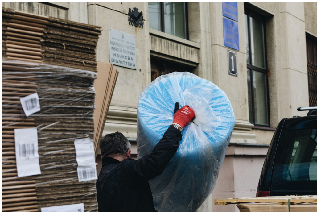
Il. 6. Odbiór transportu w Bibliotece Naukowej Politechniki Lwowskiej.