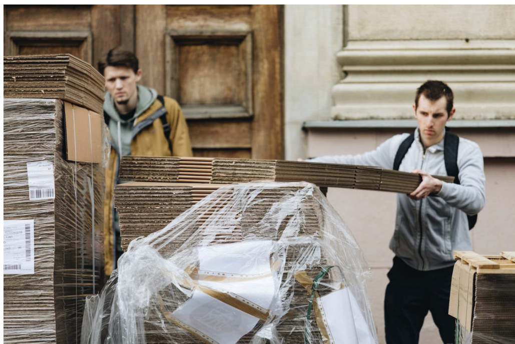
Il. 7. Odbiór transportu w Bibliotece Naukowej Politechniki Lwowskiej.