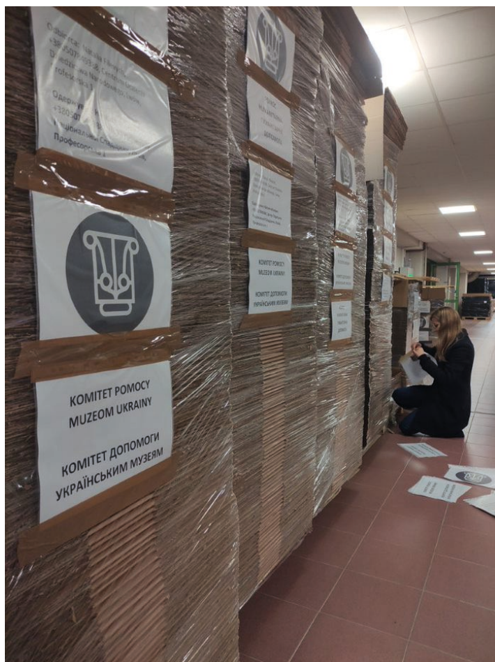
Il. 1. Pakowanie materiałów w Warszawie.