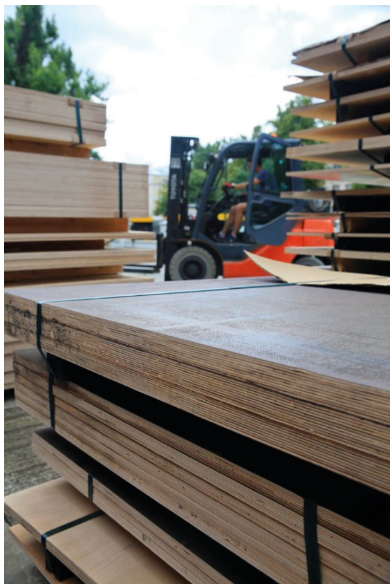
Il. 3. Transport Łotewski.