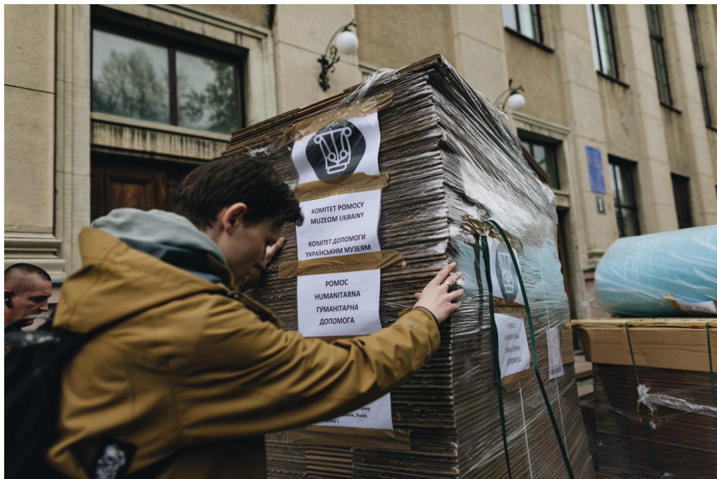
Il. 5. Odbiór transportu w Bibliotece Naukowej Politechniki Lwowskiej.