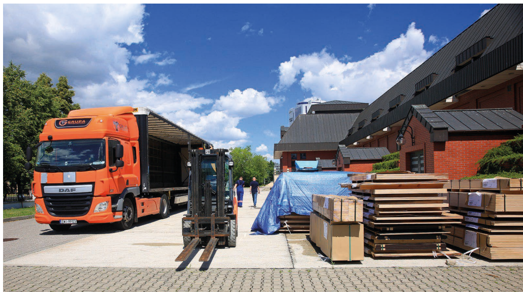
Il. 2. Transport Łotewski.