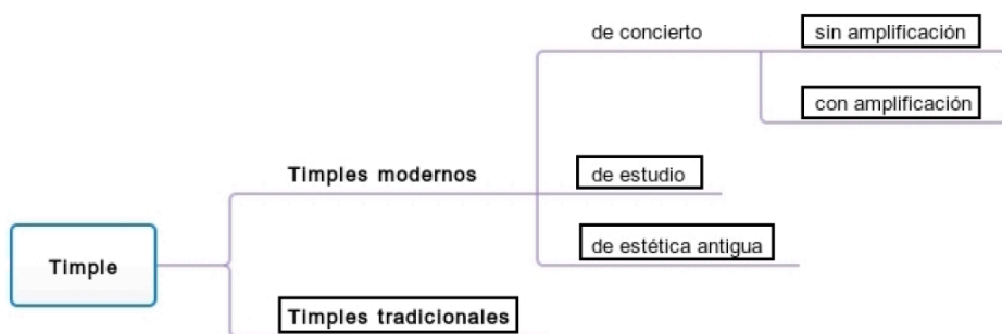
II. 4 Propuesta de clasificación de grupos de timple

Como se puede apreciar, la división general de los tipples se realiza en dos grandes grupos: tipples tradicionales y tipples modernos. En este último grupo se ha propuesto una subdivisión en tres subgrupos: tipples de concierto, que pueden o no presentar elementos de amplificación (con la diferencia constructiva que ello supone), tipples de estudio y tipples de estética antigua.