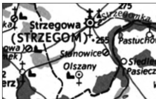
Ryc. 2. B. Kaczmarski i in., „Śląsk w końcu XVIII wieku”, skala 1:500 000, w: „Śląsk w końcu XVIII wieku”, t. 2, red. J. Janczak, cz. 1: „Mapy”, Wrocław 1983 (Atlas historyczny Polski. Mapy XVIII wieku), tabl. 5. krzyż taciński – kościół rzymskokatolicki; odwrócony krzyż taciński – kościoły ewangelickie; krzyż taciński na trójkątnej podstawie – klasztory