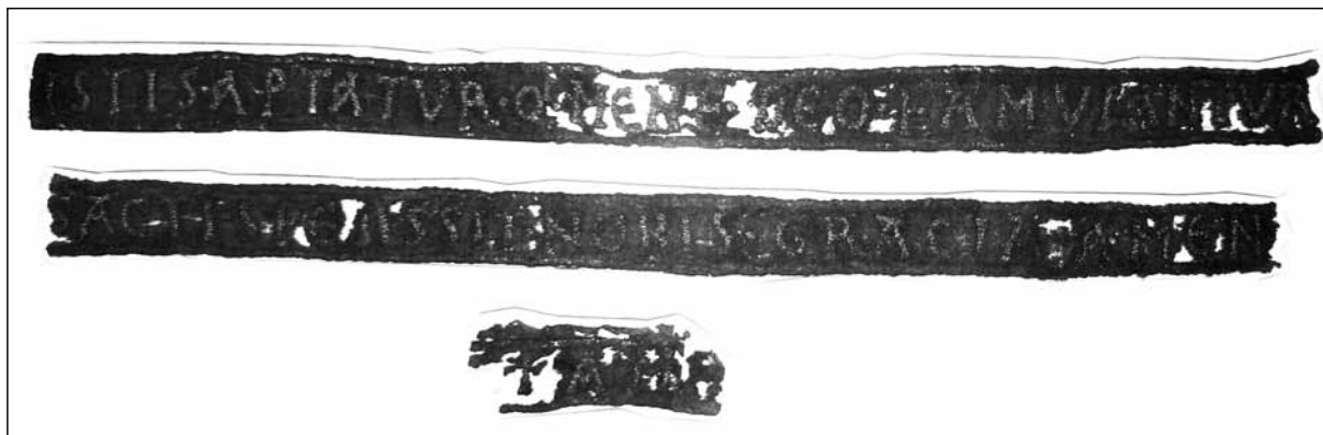
1. Pasma jedwabne z inskrypcjami, z grobu nr 24 w kolegiacie św.św. Piotra i Pawła w Kruszwicy (depozyt Instytutu Archeologii i Etnologii PAN w Muzeum Narodowym w Warszawie, sygn. Dep. 2741/2 a-c), stan obecny

horyzontalnym. Wzdłużne krawędzie pasem, podłożone na lewą stronę, na całej długości obszyto haftem wykonanym tą samą złożoną nicią. Stworzono w ten sposób kontur-obramienie pola napisu, pozostawiając pomiędzy obszyciem brzegów a napisem światło ok. 0,5 cm u góry i ok. 0,7 cm u dołu. Ujęcie pola inskrypcji haftowanym obszyciem oraz rozmierzenie napisów upodabnia pasma do tzw. filakterii (bänderoli) występujących zarówno w iluminacjach kodeksów, jak również na przedmiotach romańskiej metaloplastyki 5 . Napisy wyszyto kapitałą romańską z elementami uncjały. Wysokość liter jest zróżnicowana i zawiera się w przedziale 2–3,5 cm. Inskrypcje starano się rozmierzyć przejrzycie. Zastosowano przy tym znaki rozdzielające w formie interpunktusów (o średnicy ok. 0,4 cm), a ponadto kontrakcje, jedną ligaturę i zabieg litericzny zbliżony do enklawy — nadpisanie pomniejszonego I tuż nad poprzedzającym Q , jeszcze w polu tej litery, którego zasięg wyznacza jej charakterystyczny ogonek.