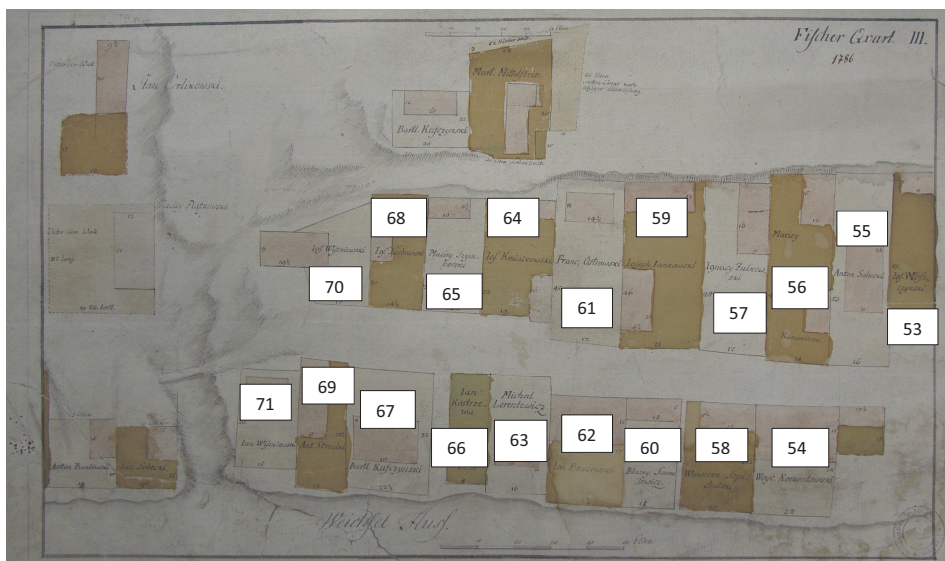
Ryc. 2. Żabieniec (część zachodnia) na planie Rybaków z 1786 roku (wg APT, Kart. 329, T. 39, I)