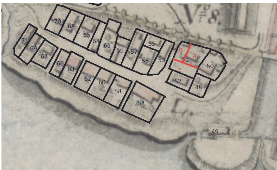
Ryc. 1. Żabieniec na planie Douglasa z 1793 roku (wg APT, Kart. 283, T. 471)